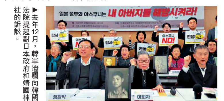
去年12月，對日本政府和靖國神社的訴訟。韓軍遺屬向韓國法院提起對日本政府和靖國神社的訴訟。

去年12月，二戰時期被日軍強制徵兵的部分韓籍遇難者遺屬向首爾中央地方法院提起訴訟，要求日本靖國神社撤下未經同意的合祀的先人牌位，並向日本政府及靖國神社索賠8.8億韓圓（約合420萬元人民幣）。這是被日本政府擅自強制合祀在靖國神社的韓軍遺屬首次向韓國法院提起對日本政府和靖國神社的訴訟。