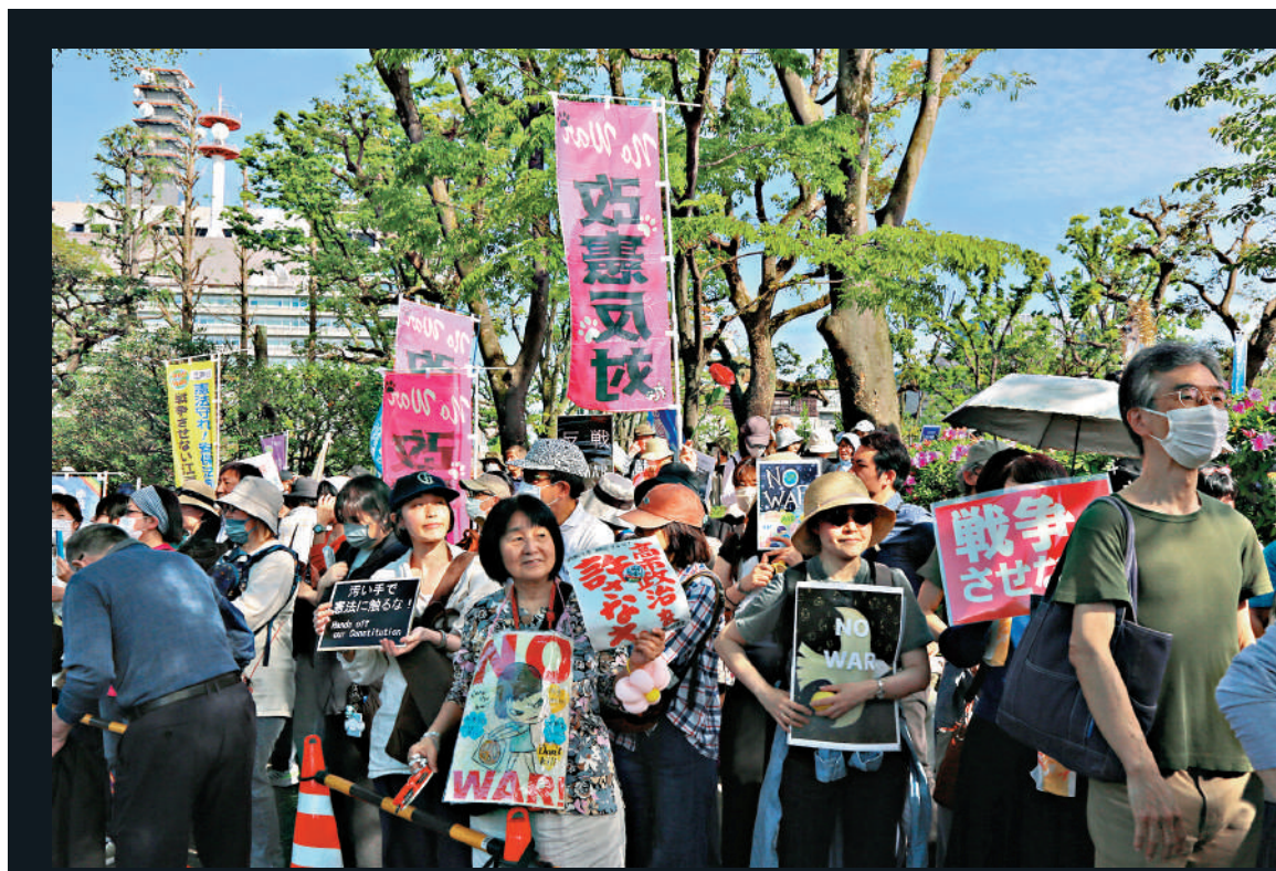
高市早苗內閣推動設立「國家情報局」，引發巨大爭議。4月19日，超10萬名日本民眾在位於東京的國會議事堂前集會，抗議高市早苗政府強推修憲、企圖解禁殺傷性武器出口等破壞和平憲法的動向。

陳靜靜還說，日本試圖深度嵌入美國亞太情報體系，藉機深度綁定美日同盟，擴大機密信息共享，徹底淪為美國「印太戰略」的前沿情報幫兇，嚴重威脅地區各國海空、網絡與信息安全。早在法案通過前一日（3月12日），日本共同社便爆出消息，日美計劃擴大機密情報共享範圍，通過防衛力量的緊密合作提升威懾和應對能力。日本通過整合升級海外情報掌控能力，全力配合美國亞太情報布局，旨在成為美國在亞太地區情報架構中的關鍵節點。