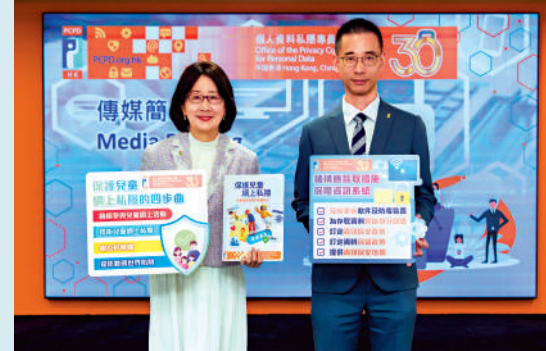
私隱專員鍾麗玲（左一）及又一村花園俱樂部資料外洩事件的調查報告。

又一村花園俱樂部去年10月向公署通報，存放在伺服器內的管理系統檔案遭勒索軟件加密，無法運作，事件影響9045名會員及前會員的個人資料，包括姓名、身份證或護照號碼、出生日期、聯絡電話及地址等資料懷疑外洩。