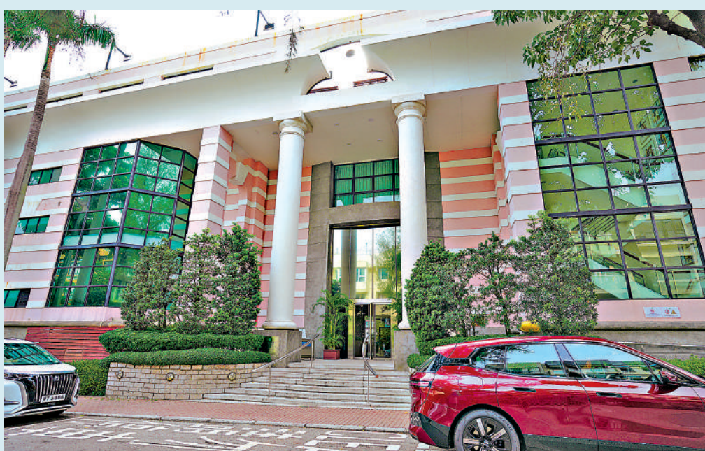
又一村花園俱樂部成立於一九八九年，佔地七萬平方呎，經常舉辦不同體育活動。