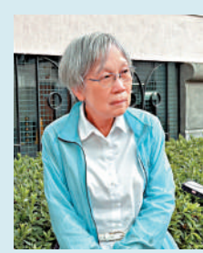
會員黎女士表示，擔心也沒用，如果有陌生來電就提高警覺。