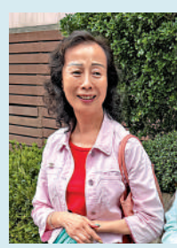
會員曾女士表示，已加入俱樂部多年，不太擔心。