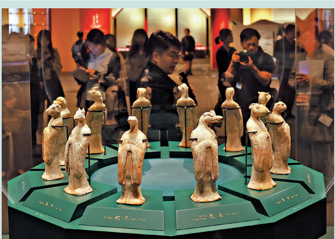
◀展覽現場展示的唐代十二生肖俑。