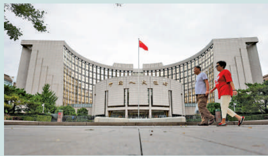
▲人行等八部門制定了《金融產品網絡營銷管理辦法》，9月30日實施。

《辦法》要求第三方互聯網平台加強信息披露。要求網絡營銷內容使用準確通俗的語言介紹金融產品關鍵信息，不含有虛假或者引人誤解的內容。針對算法推薦、直播營銷等新模式，以及強制搭售、騷擾營銷、違規使用金融字樣等問題，提