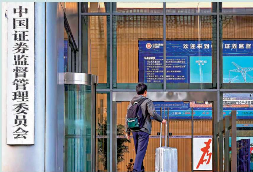
▲中證監昨公布，即日起，允許合格境外投資者參與國債期貨交易。

中國金融期貨交易所目前上市的國債期貨包括30年期、10年期、5年期和2年期四個品種。所有品種合約交割月份固定為3月、6月、9月和12月等季月。