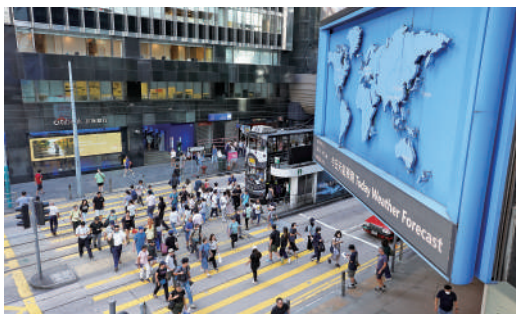
▲受惠市場波動下保險需求增加，本港多家保險公司去年表現理想。

保監局指出，保險公司就大埔宏福苑火災作出賠付及預留準備金後，在岸財產損壞業務的承保利潤，從6億元顯著下降至1580萬元，跌幅高達97.2%。