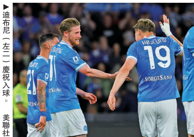
▲迪布尼(左二)慶祝入球。

【大公報訊】拿玻里在香港時間25日凌晨舉行的意甲第34輪比賽，主場以4:0擊敗克雷莫納，34歲傳奇比利時中場奇雲迪布尼於上半場入球，助其累計歐洲5大聯賽入球達到100個。這一里程碑橫跨其德甲、英超及意甲生涯，他本季代表拿玻里出戰18場已貢獻5球3助攻，並在賽後當選全場最佳球員。