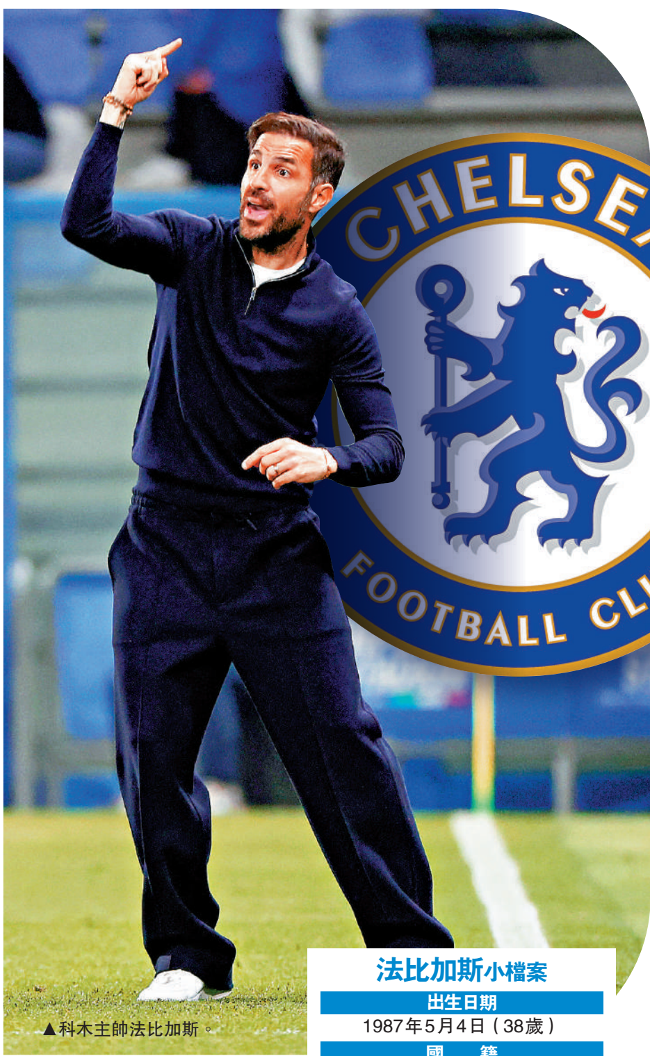
▲科木主帥法比加斯

法比加斯本人對此的態度則較為保留。他表示從未在班主那裏聽到任何消息，對傳聞一無所知。他認為此刻考慮其他不重要的事情是愚蠢的，因為如果他想的不是在接下來5場比賽爭勝，以及帶領球隊首次取得歐洲賽入場券，那才是真正的愚蠢。法比加斯這樣表態，只因他今季仍有重要的目標要追求。不過，他球員時代曾為車路士贏得兩次英超冠軍，以及英足盃、英聯盃和歐霸盃冠軍，目前他正是車路士新帥的最大熱門。