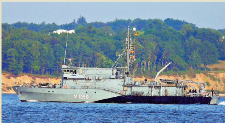
▲德國計劃將「富爾達」號掃雷艦部署至地中海。

另據路透社披露，土耳其外長費丹24日表示，如果美伊達成和平協議，土耳其可能會考慮參與霍爾木茲海峽的掃雷行動。