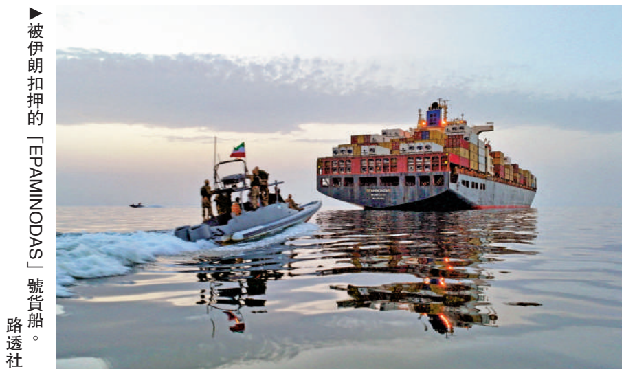
▲被伊朗扣押的「EPAMINODAS」號貨船。