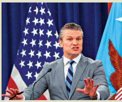
▲美防長海格塞斯24日在伊朗戰爭簡報會上講話。

儘管如此，特朗普多次聲稱自己應獲得諾貝爾和平獎。特朗普本月17日表示，算上伊朗和黎巴嫩，他已經「結束了10場戰爭」，再度招致大量批評。