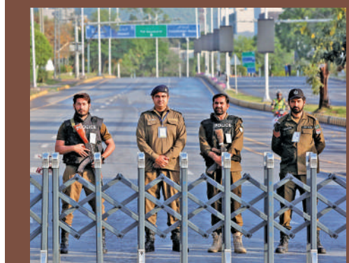
▲巴基斯坦警察25日在伊斯蘭堡重點區域站崗警戒。

針對美軍持續對伊朗實施海上封鎖，伊朗武裝部隊哈塔姆安比亞中央總部發言人25日指出，如果美軍繼續在地區內實施封鎖、搶劫及海盜行為，必將面臨伊朗強大武裝力量的回應。