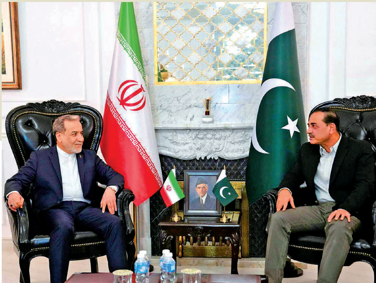
▲伊朗外長阿拉格齊25日在伊斯蘭堡與巴基斯坦陸軍參謀長穆尼爾(右)舉行會談。

美國與伊朗在本周末是否會在巴基斯坦展開第二輪談判，備受關注。阿拉格齊25日在伊斯蘭堡與巴陸軍參謀長穆尼爾舉行會談，這是他本次三國之行的第一站，其他兩國還包括阿曼和俄羅斯。阿拉格齊讚賞巴政府為促成停火和結束戰事作出的努力，並闡述了伊朗在此問題上的立場和考量。