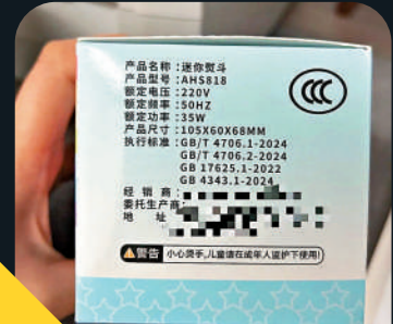
▲外接220伏電的熨斗不應用來加熱拼豆。

●未成年人使用加熱工具時，家長須全程監護，避免獨自操作。使用後及時斷電，遠離易燃物品。