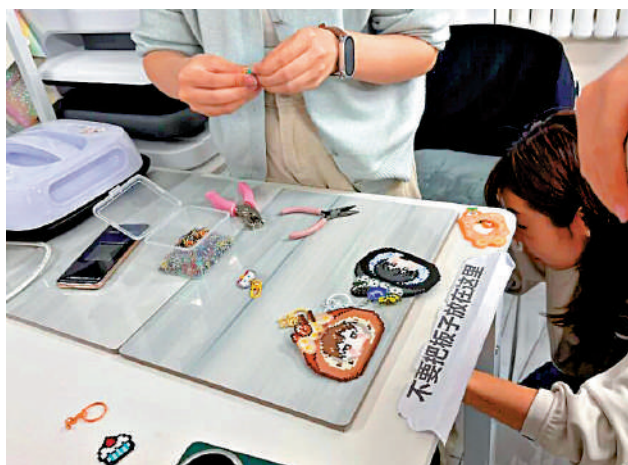
▲在拼豆線下店，出於安全考量，顧客不得自行使用店內設備熨燙拼豆。

熱鬧背後，風險也多次顯現。由於高溫加熱熨燙塑料製品是拼豆製作必不可少的環節，燙傷、燒傷、觸電等安全風險也隨之而來。今年以來，全國已發生多起拼豆熨斗導致的燒傷事件。此外，市場上出現大量三無產品，部分玩具導致漏電、起火等安全事故。對此，貴州、四川等多地市場監管部門開展專項排查整治行動。中國消費者協會21日也發出提醒，消費者購買使用拼豆產品時要注意理性選購，遠離「三無」商品。