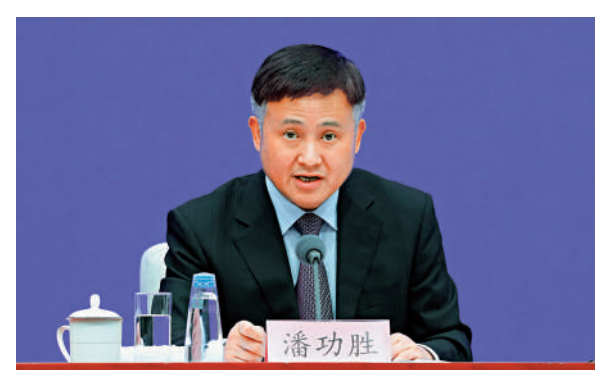
▲潘功勝表示，積極穩健推動地方政府融資平台債務和中小金融機構風險化解。

曲吉山指出，一是帶頭做好自身「學查改」。樹立和踐行正確政績觀，結合紀檢工作「三化」建設年行動再集中抓兩年部署，始終堅持實事求是、嚴格依規依紀依法，準確規範運用「四種形態」。二是着力健全權力監督制約。推動抓好制度建設，