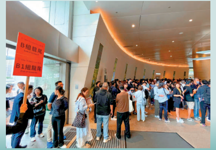
▲首岸昨日開售迫爆商場大堂，B1組人龍排至IFC天橋。