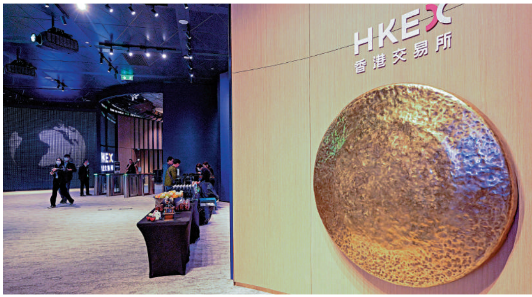
▲近年不少內地企業在港上市，所以香港可充當跨境併購平台，以促進中資企業全球布局。