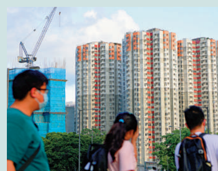
▲為了爭奪市場，一些銀行會向按揭客戶提供現金回贈。