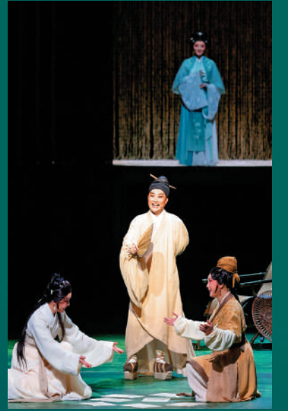
舞台具當代劇場質感。