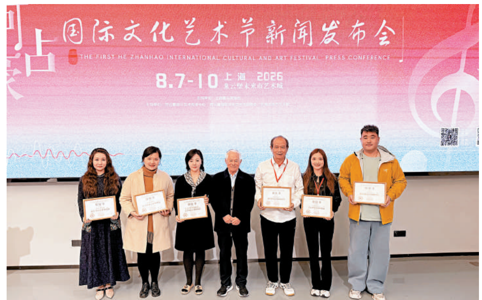
何占豪（中）向本次「何占豪國際文化藝術節」各組織單位頒發授權狀。

值得一提的是，大灣區的觀眾和青少年學子，也是何占豪一直牽掛的。在接受記者採訪時，他笑着說，香港不僅有他的學生，還有令他難忘的觀眾。每次赴港演出，他總會被大家的高度熱情和音樂素養所打動，因此他也非常喜歡到香港去演出。同時，以香港中樂團為代表的香港音樂界多年來也為民族音樂傳承推廣作出了