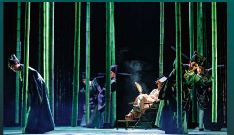
越劇《蘇東坡》亦是內地與香港藝術家及創作團隊的一次創新實驗。