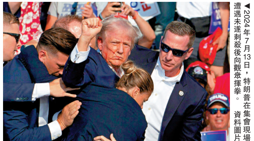
▲2024年7月13日，特朗普在集會現場遭未遂刺殺後向觀眾揮拳。資料圖片