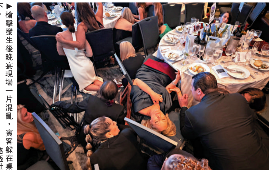
▲槍擊發生後晚宴現場一片混亂，賓客躲在桌下。

槍擊發生後不久有消息稱，槍手已被擊斃。但特朗普在社交媒體發布槍手赤膊上身、臉朝下趴在酒店地上的照片，並公布一段監控錄像。畫面顯示，槍手持槍衝過安檢關卡，安檢人員拔槍追擊。警方表示，執法人員與槍手交火，一名特勤局人員中彈，但因身穿防彈背心躲過一劫。槍手並未中彈，在宴會廳外走廊被制服，警