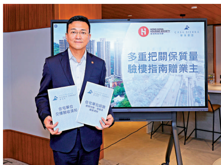
▲為了減少業主入伙前的執修需要，房協制定全新驗收指引措施，委託獨立測量師多驗收一次，以及提供視頻和文字形式的驗樓指南。