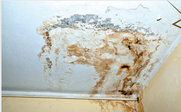
▲不少市民因為住所滲水問題而受困擾，政府計劃最快今年年中推行調查滲水新措施，希望將處理程序縮減至兩星期。

他續指出，食環署去年收到共4.6萬宗滲水投訴，99.5%單位滲水源頭是上層單位，強調政府檢測「有根有據」，若業主堅信單位非滲水源頭，亦可不自費檢測，留待政府之後作詳細檢測。他強調業主有責任檢查滲水問題，若要求他人舉證滲水源頭，是抱消極心態；若政府介入，檢測費至少1.7萬元，而透過合資格水喉師傅檢測和維修可能只需數千元，相較之下相信業主懂得選擇。