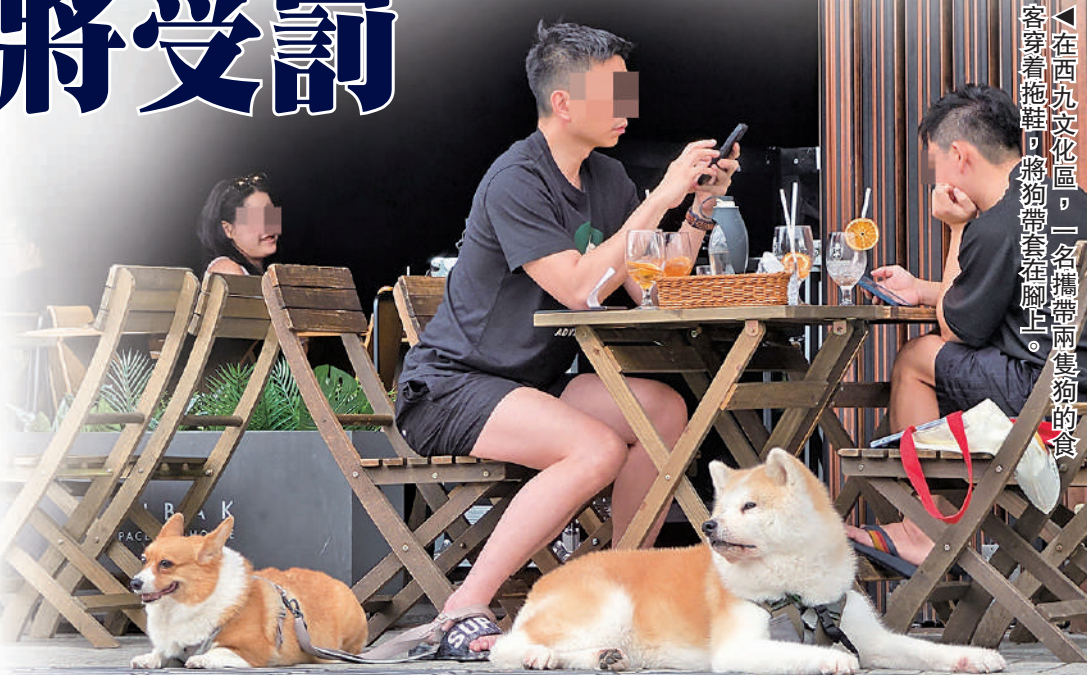
▼在西九文化區，一名攜帶兩隻狗的食客穿着拖鞋，將狗帶套在腳上。

資料顯示，食客若未能符合規定而攜帶狗隻進入食物業處所，罰則將與現行違法攜帶狗隻進入食物業處所相同，一經定罪，最高可罰款10000元、監禁三個月及每日另加300元罰款。如食肆在12個月內三次違反狗隻相關的法例要求及或牌照條件，會被取消其容許狗隻進入的准許，但一般不會影響其原有食肆牌照，惟該食肆在一年內不得再申請讓狗隻進入。