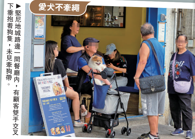
▼堅尼地城路邊一間餐廳內，有顧客雙手交叉下垂抱着狗隻，未見牽狗帶。