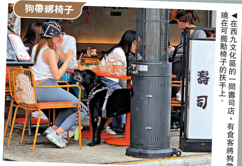
▼在西九文化區的一間壽司店，有食客將狗帶繞在可搬動椅子的扶手上。