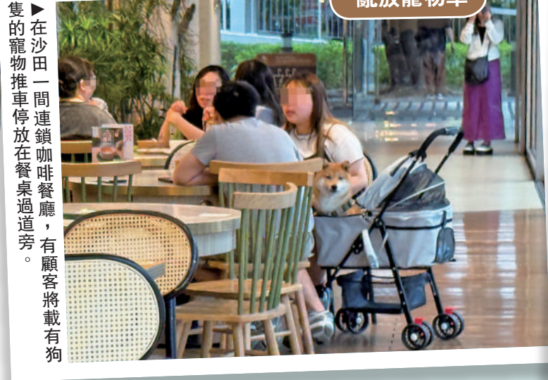
▼在沙田一間連鎖咖啡餐廳，有顧客將載有狗的寵物推車停放在餐桌旁。