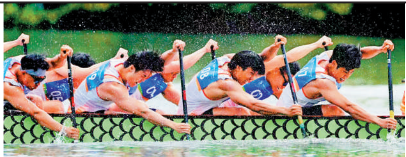
▲港隊取得今屆亞沙運龍舟項目首枚獎牌。