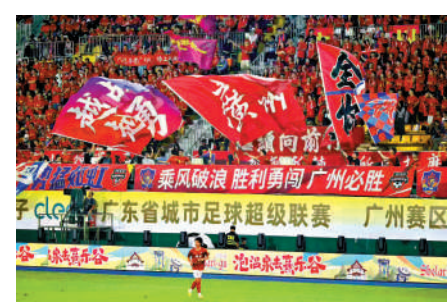
▲粵超首輪比賽，各大球場座無虛席。受訪者供圖

【大公報訊】記者敖敏輝廣州報道：繼粵BA民間籃球盛事後，25日，粵港澳大灣區又一民間足球盛宴——廣東省城市足球超級聯賽(下稱「粵超」)正式開賽。揭幕戰上，主場作戰的廣州隊以2：0力克江門隊。4月26日，賽事首輪多場對決全面打響。粵超受到廣大球迷熱捧，賽事門票供不應求、賽場觀眾爆滿，並帶動了周邊文旅消費。