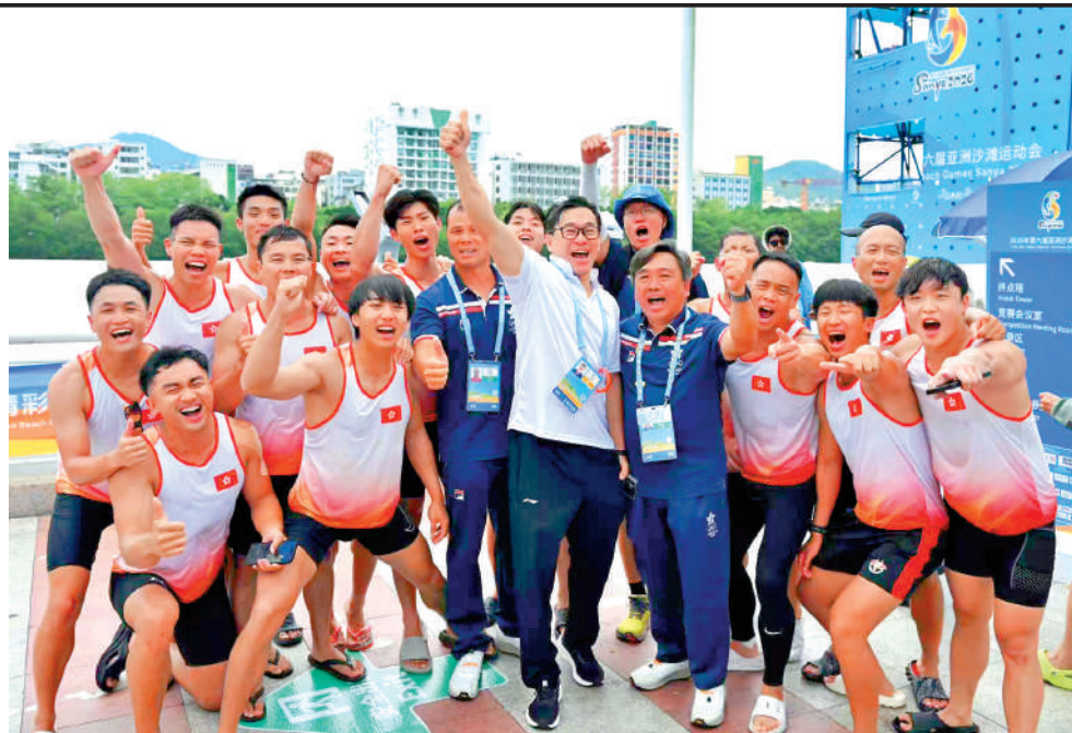
▲慶祝獲得400米賽銅牌。

龍舟比賽壓軸日上演男、女子組12人龍舟400米直道賽兩項決賽。港隊在男子組初賽以1分43秒503的時間獲小組第2名出線準決賽，繼而以1分37秒415取得小組次名，聯同首名的中國台北隊躋身由4隊角逐的決賽；港隊於決賽造出1分40秒188的成績，以0.022秒之微力壓中國台北隊而奪得銅牌，冠、亞軍就分別由國家隊及泰國隊奪得，時間分別為1分34秒990和1分35秒614。