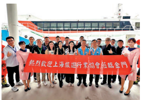
▲上海旅遊業人士27日抵達金門，展開3天2夜的交流與踩線行程。

金門縣府觀光處表示，為了迎接上海客群，目前已規劃一系列行銷活動，並將於近期赴上海辦理旅遊推廣與業者交流，持續深化兩地觀光之交流。未來將持續與相關單位溝通，配合兩岸政策走勢，積極爭取更多大陸重點城市居民來金門旅遊，並持續深化「小三通」航線的交通樞