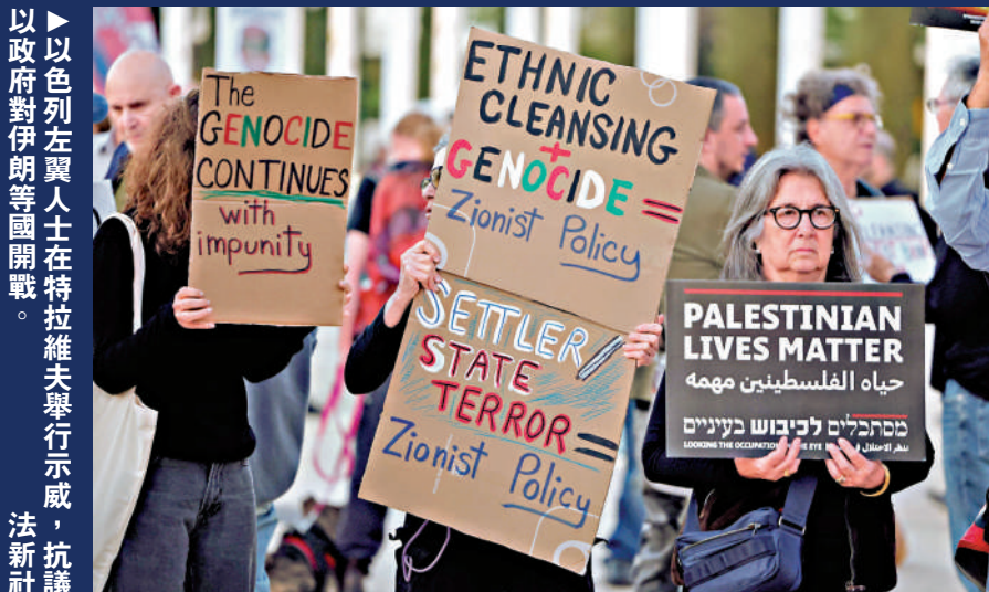
以色列左翼人士在特拉維夫舉行示威，抗議政府對伊朗等國開戰。

貝內特和拉皮德存在巨大分歧。拉皮德曾公開表態支持「兩國方案」，但貝內特在巴以問題上立場更為強硬，堅稱以色列讓巴勒斯坦建國等同「自殺」。