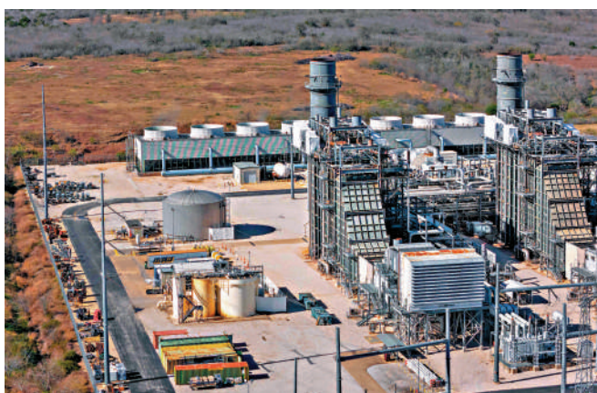
位於得州的巴斯托羅普能源中心發電廠。

報告稱，如果用戶持續拖欠電費或燃氣費，美國公用事業公司會採取停電或停氣的措施。美國能源政策專家和消費者權益組織指出，上述數字遠高於預期水平，反映出美國家庭正面臨極為嚴重的財務困境。專家警告，由於美國近幾年能源價格進一步上漲，居民當下的處境只會更加嚴峻。