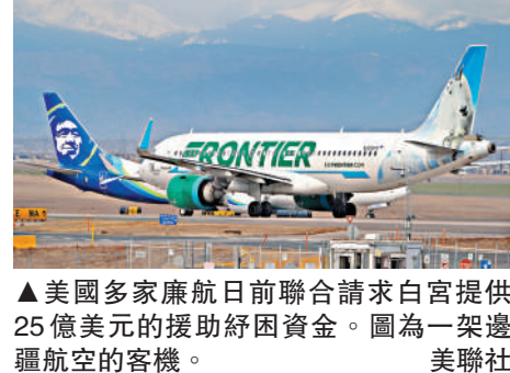
▲美國多家廉航日前聯合請求白宮提供25億美元的援助紓困資金。圖為一架邊疆航空的客機。

據悉，美國邊疆航空公司和阿韋洛航空公司等多家廉航的CEO已與交通部長達菲和聯邦航空管理局局長貝德福特見面，預計未來幾天將繼續討論可能的援助