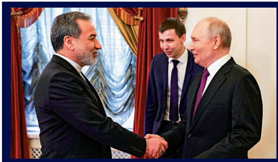
▲普京(右)27日在聖彼得堡會晤伊朗外長阿拉格齊(左)。