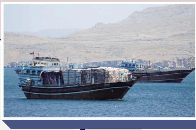
▲被困船隻面臨補給不足問題，且時刻擔憂遭到襲擊。