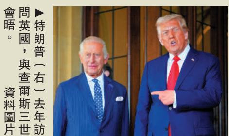
▲特朗普(右)去年訪英，與查爾斯三世會晤。資料圖

負責後勤的英國官員透露，並未安排特朗普與查爾斯在白宮橢圓形辦公室回答記者提問。這原本是他國元首到訪白宮的常規環節。特朗普近期多次指責英國首相斯塔默，聲稱英國在伊朗戰事上未向美國提供幫助，並嘲笑英國海軍實力孱弱。一份五角大樓備忘錄顯示，特朗普政府可能撤回對英國關於馬島主權主張的支持。