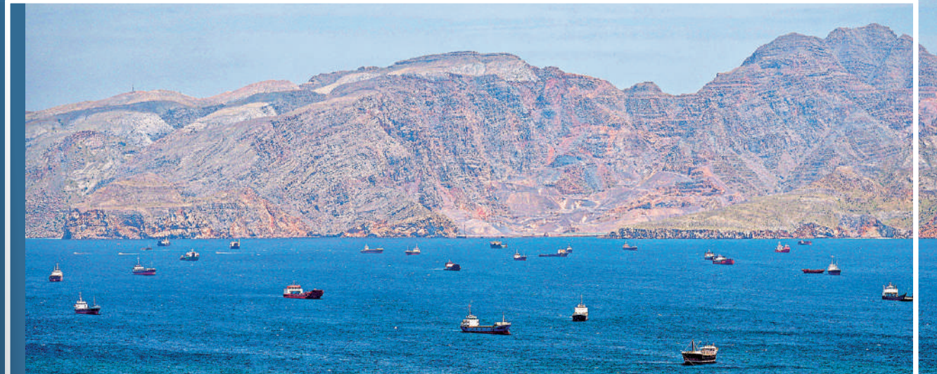
▲大量船隻27日仍被困在霍爾木茲海峽附近水域。