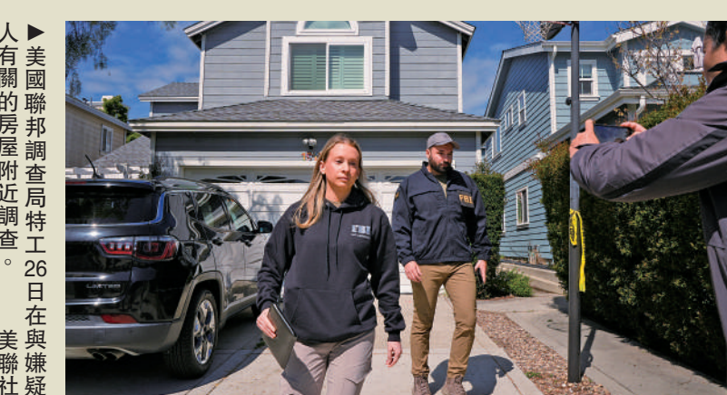
▲美國聯邦調查局特工26日在與嫌疑有關的房屋附近調查。

中國外交部發言人林劍27日就此次槍擊事件回應說，中方一貫反對和譴責非法暴力行為。