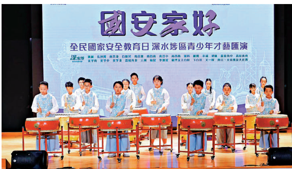
▲深水埗區早前舉辦了「國安家好——全民國家安全教育日」青少年才藝匯演。