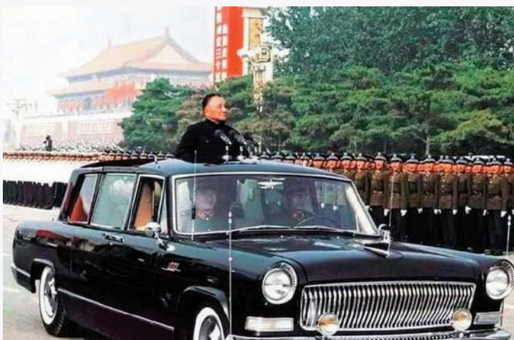
▲1984年10月1日，鄧小平乘坐敞篷車檢閱中國人民解放軍受閱部隊。

20世紀70年代末和80年代，人民解放軍在保衛國家領土主權鬥爭中出色地履行了職責。1979年二、三月間，我邊防部隊實施對越邊境自衛反擊作戰。1981年實施收復法卡山、扣林山作戰。1984年實施收復老山作戰，此後又進行長達數年的老山堅守防禦作戰，邊境地區的局勢得到穩定。1988年3月，我海軍艦船對竄到我南沙群島赤瓜礁海區進行挑釁的越南海軍艦船進行還擊。這些自衛還擊作戰，保衛了我國領土主權完整，維護了國家尊嚴，展現了人民解放軍威武之師的形象。