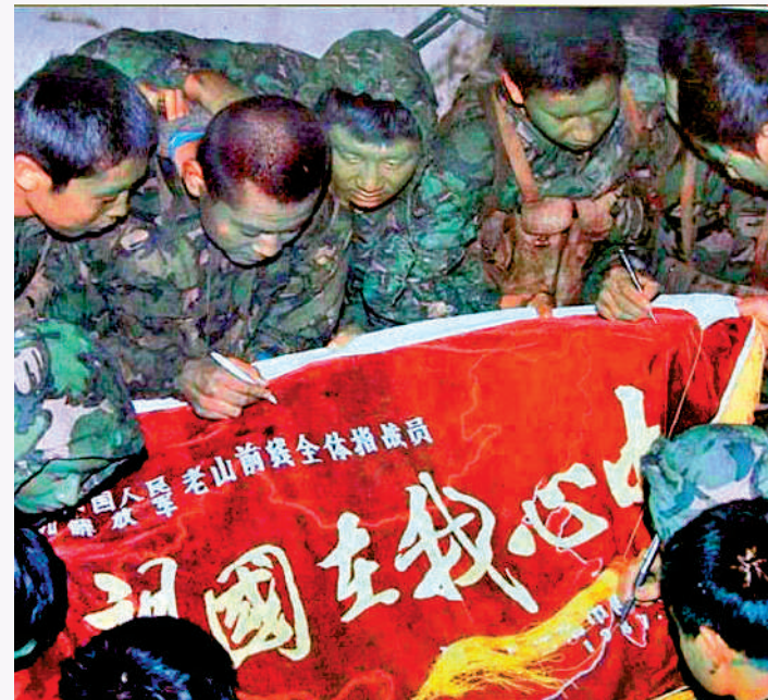
▲對越自衛反擊戰中，戰士們在自製貼有「祖國在我心中」字樣的紅旗上簽名，表達保衛祖國的決心。