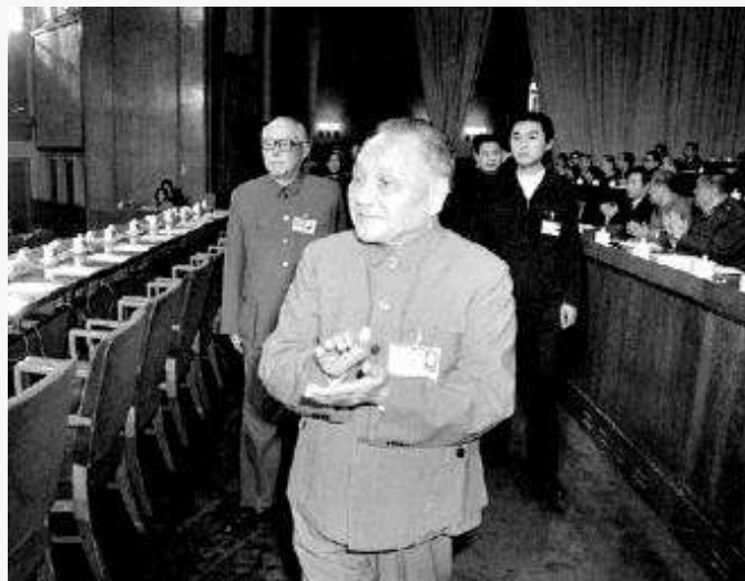
▲鄧小平、李先念步入十三大會場。