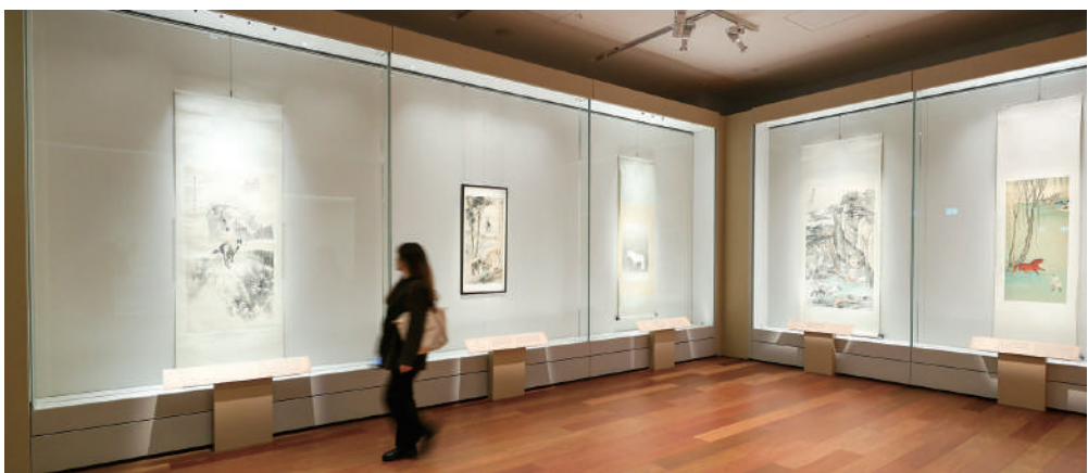
▲「天馬凌雲——故宮博物院藏繪畫珍品」展覽呈獻近100件橫跨元代至20世紀的馬題材繪畫。