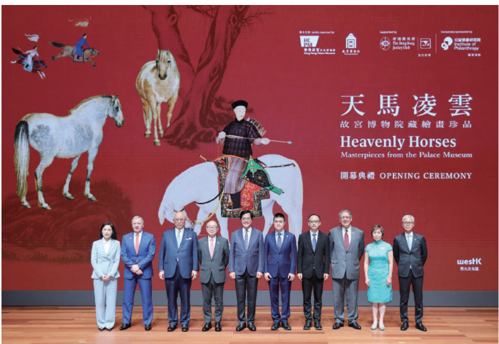
▲「天馬凌雲——故宮博物院藏繪畫珍品」今年三月舉行開幕典禮。主禮嘉賓包括香港特區政府財政司副司長黃偉綸(左五)、中央政府駐港聯絡辦宣傳文體部副部長林枏(右四)、故宮博物院常務副院長婁璋(右五)、馬會主席廖長江(左四)、馬會副主席兼公益慈善研究院主席黃嘉純(右三)、馬會慈善信託基金信託人兼公益慈善研究院副主席龔楊恩慈(右二)、馬會行政總裁兼公益慈善研究院董事應家柏(左二)、香港故宮文化博物館董事局主席孔令成(左三)、西九文化區管理局行政總裁馮淑儀(左一)，以及香港故宮文化博物館館長吳志華博士(右一)。

馬會推出馬年系列活動連繫社區，表彰人馬情誼，其中目前分別在香港及北京舉行的馬匹藝術珍品展覽，引領觀眾走入古今的馬世界，深化對中華馬文化的認識；至於已先後於包括香港等地進行了首映的首部中國生肖動物主題電影《馬到功成》，頌揚馬匹特質，與世界一同感受馬匹魅力。