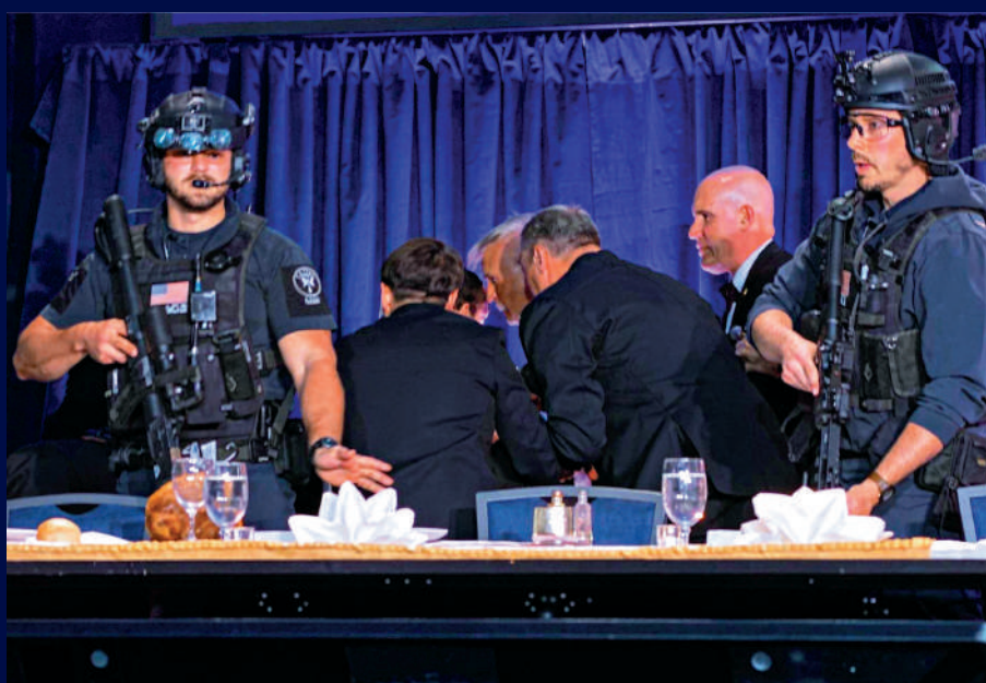
▲25日，白宮記者協會晚宴突傳槍聲，特工衝上台保護特朗普。