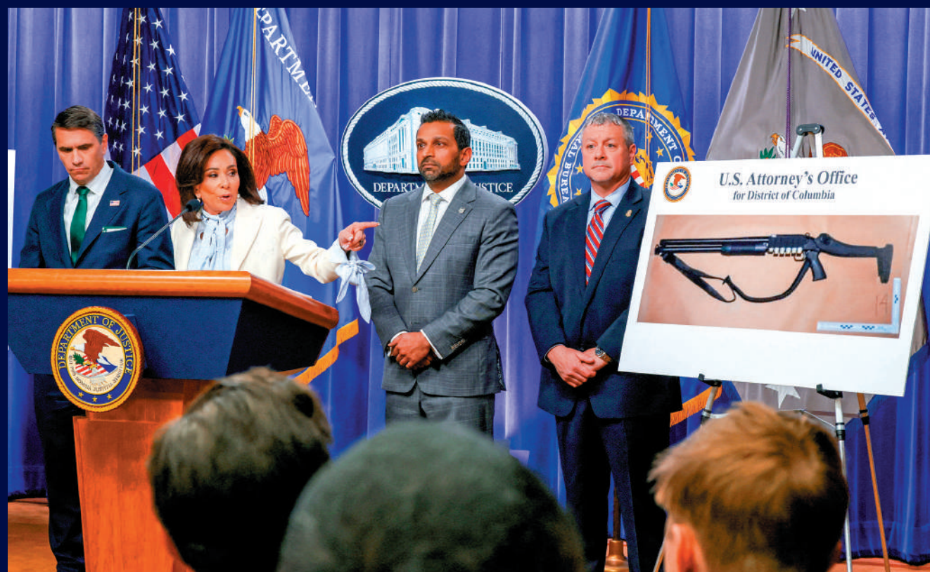
武器照片。美國聯邦檢察官皮羅（左二）27日在發布會上展示槍手使用的