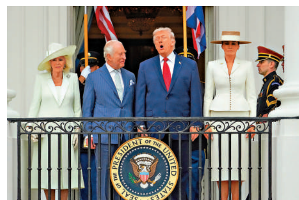
▲（左起）卡米拉、查爾斯、特朗普和梅拉尼婭28日在白宮合影。

美媒指出，過去的國事訪問期間，特朗普會帶著客人離開白宮四處遊覽，但此次特朗普夫婦不會外出，凸顯白宮記者協會晚宴槍擊案引發的安全擔憂。