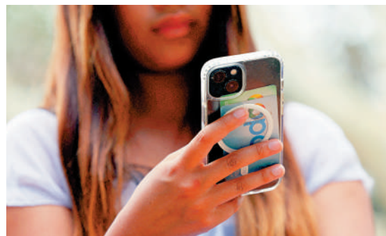
▲澳洲政府指出，人們越來越習慣於在線上平台看新聞。

澳洲總理阿爾巴尼斯表示，拒絕達成協議的科企須支付相當於澳洲業務營收2.25%的強制性稅款。澳洲通信部長韋爾斯說：「人們越來越習慣從Facebook、TikTok和谷歌直接讀取新聞，新聞工作者的辛勞付出豐富了大型數碼平台的內容，為它們帶來營收。平心而論，做一些補償是公平的。」韋爾斯補充說，如果平台拒絕與新聞機構達成協議，就由澳洲政府代收費用，再轉交給新聞機構。新法將取代2021年制定的法律，旨在防止數碼平台刪除新聞內容以規避稅務。當時Meta一度阻止用戶分享新聞，過後才與澳洲數碼媒體公司達成協議，但這些協議已於2024年到期。Meta發言人稱，新法其實是「數碼服務稅」。谷歌稱，公司與澳洲90多家新聞機構有商業協議，目前正在審議新草案。對於美國總統特朗普反對數碼服務稅，並威脅以關稅報復，阿爾巴尼斯說：「我們是主權國家，政府基於澳洲國家利益做決策。」