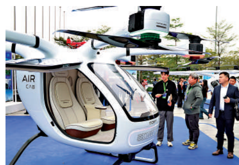
▲粵港可攜手打造低空經濟高地。圖為在廣州舉行的2025粵港澳大灣區低空經濟高質量發展大會上展出的低空飛行器。