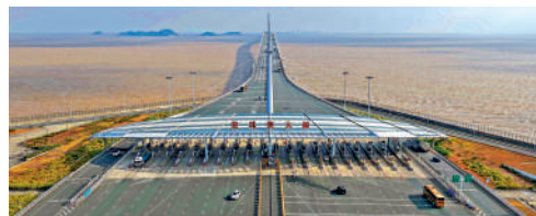
▲粵港將加快基礎設施互聯互通，促進人員、信息流動更加高效順暢。圖為車流經過港珠澳大橋。

要的最大特點，就是將大灣區建設置於更加核心的位置。「不僅放在首要章節，而且作為牽引全局的重點任務，貫穿經濟社會發展全過程。」他認為，香港制定五年規劃時，可將經濟轉型、城市競爭力提升、民生問題改善、大灣區協同合作等領域納入專章部署，並出台具體舉措；也可考慮將粵港澳合作整體納入框架中，通過制度對接與資源整合，把握合作發展帶來的新空間、新機遇，推動香港更好融入和服務國家發展大局。