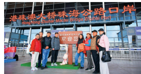
▲粵港將用好公路交通等基建互通機制，推動港珠澳大橋經貿新通道建設。圖為旅客在港珠澳大橋珠海公路口岸合影留念。

加強與港澳立法、執法、司法各環節全流程協作，完善涉港澳商事糾紛解決機制，推動粵港澳大灣區成為商事解紛和企業重整優選地。