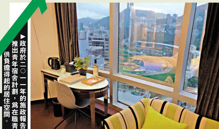
政府於二〇一一年推出一項青年宿舍計劃，為在職青年提供負擔得起的居住空間。