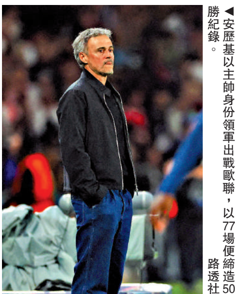
▲安歷基以主帥身份領軍出戰歐聯，以77場便締造50勝紀錄。