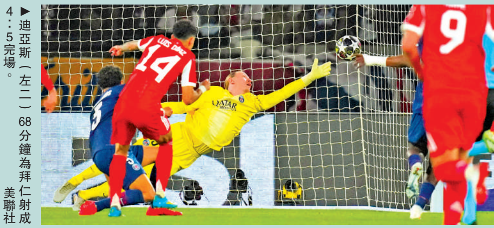
4:5完場。(左二) 68分鐘為拜仁射成美聯社