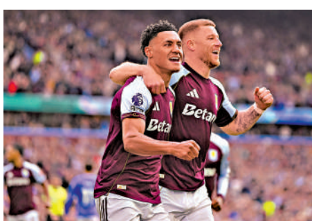
▲維拉暫位居英超第5，但近況反覆。

維拉在「歐霸之王」主帥艾馬利領軍下，被視為贏得歐霸盃冠軍的大熱門。事實上維拉在歐霸一路走來相當輕