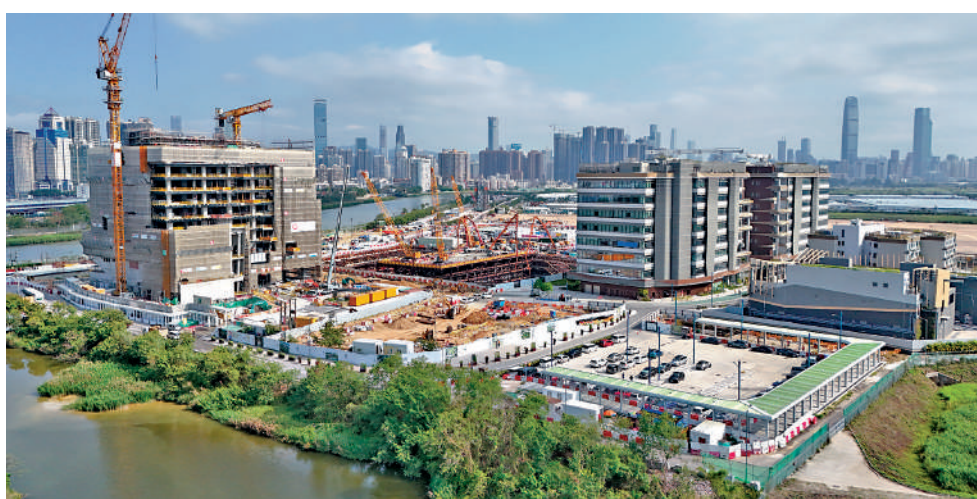
▲特區政府正編制香港首份五年規劃，有議員認為要全力推動制定北都專屬法例，使北都發展能夠提速提效。