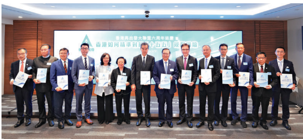
▲香港再出發大聯盟昨日舉辦「如何精準對接『十五五』規劃論壇」。

【大公報訊】記者義昊報道：香港再出發大聯盟昨日舉辦「六周年誌慶暨如何精準對接『十五五』規劃論壇」活動。多名政府官員、金融、教育界人士及專家學者共同探討「十五五」期間香港的機遇，期盼特區政府早日出台「五年規劃」對接國家的頂層戰略，同心協力共謀發展。全國政协副主席、再出發大聯盟總召集人梁振英致辭時表示，航運服務業、航天航空產業體系與香港息息相關。「十五五」期間，香港可善用固有的金融、專業服務優勢參與其中，積極助力國家對外開放。希望香港把握機遇，善用「背靠祖國，面向世界」的優勢，在「以香港所能，服務國家所需」的過程中提取自身的發展動力。