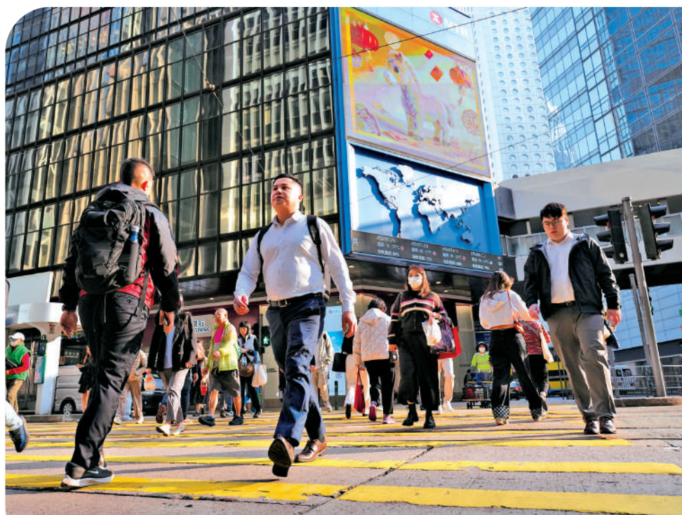
▲受外圍環境影響，本港中小企營運受到挑戰，金管局聯同銀行業推出支援措施。

當中，所有主要提供貿易融資服務的銀行將積極參與金管局推出的CargoX項目先導計劃，借助「商業數據通」數據基建連結貨運物流和貿易數據，結合貿易融資自動化方案，更有效地評估企業信貸風險，從而加快審批流程，提升中小企特別是進出口商獲取買