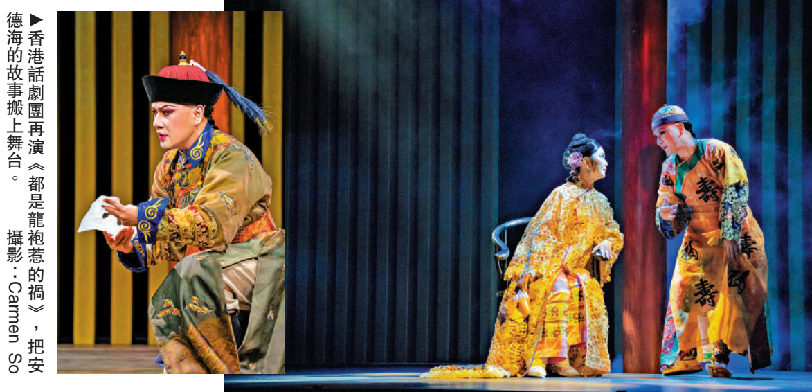
►香港話劇團再演《都是龍袍惹的禍》，把安德海的故事搬上舞台。

雖然李連英只有幾場戲，其實這個角色也有引申意思——沒了這個安德海，還有別的安德海。歷史在重演。