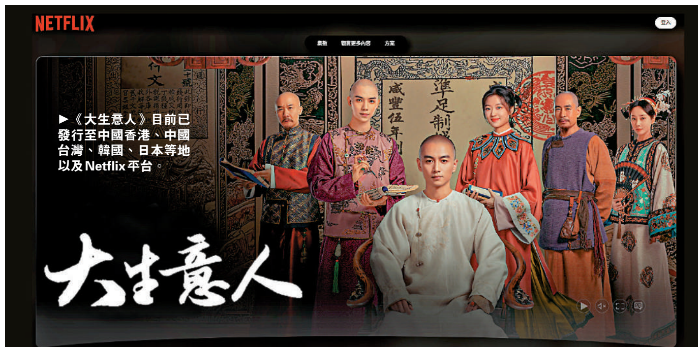
▶《大生意人》目前已發行至中國香港、中國台灣、韓國、日本等地以及Netflix平台。