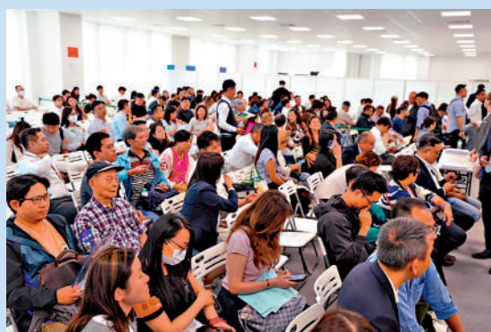
▲首岸昨日次輪銷售，售樓處繼續迫爆。

【大公報訊】一手新盤持續搶手。恒地（00012）牽頭發展的紅磡大型重建項目首岸，昨日次輪價單銷售120伙，再下一城又告搶清，套現約10億元。