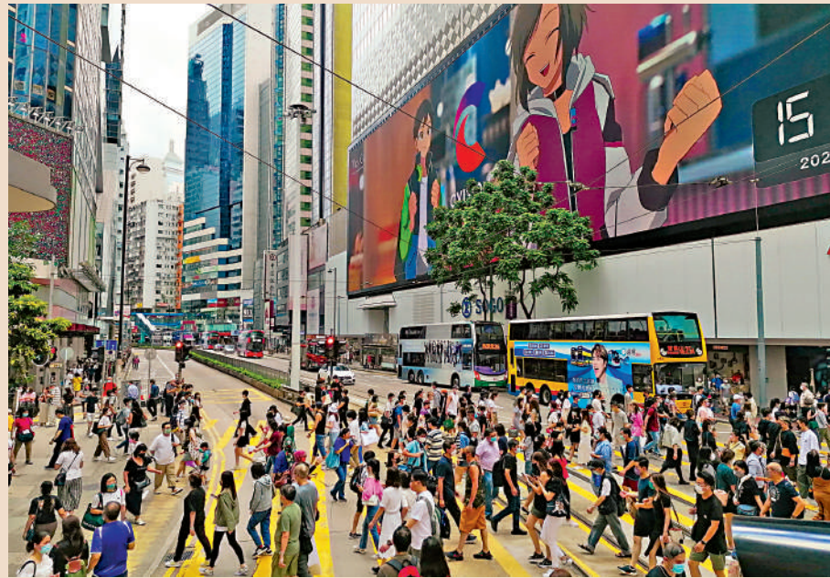
▲本港零售租金趨於合理及盛事經濟帶動訪港旅客上升，玩具反斗城及太興等零售及餐飲品牌均表示會擴充業務。