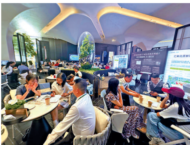
▲「五一」黃金週前夕，廣州再出樓市新政。圖為廣州一樓盤的銷售大廳。

【大公報訊】記者盧靜怡廣州報道：內地「五一」黃金週前夕，廣州再出樓市新政，為房地產市場「穩預期、促消費」加碼。30日印發的《廣州市人民政府辦公廳關於進一步促進房地產市場平穩健康發展的實施意見》，從公積金額度、置換補貼到港澳居民購房便利