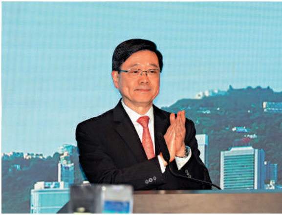
▲李家超表示，政府重視保障僱傭權益，未來會繼續推進各項相關政策措施。 大公報記者黃洋攝

【大公報訊】記者王蕙如報導：勞工處昨日舉行2026年勞動節酒會，行政長官李家超出席主禮並致辭，感謝全港「打工仔女」為香港家園作出貢獻。他強調，政府重視保障僱傭權益，法定最低工資水平5月1日起上調至43.1元，政府未來會繼續推進各項政策措施，並推動持續進修及培訓，協助在職人士持續提升生產力和競爭力。