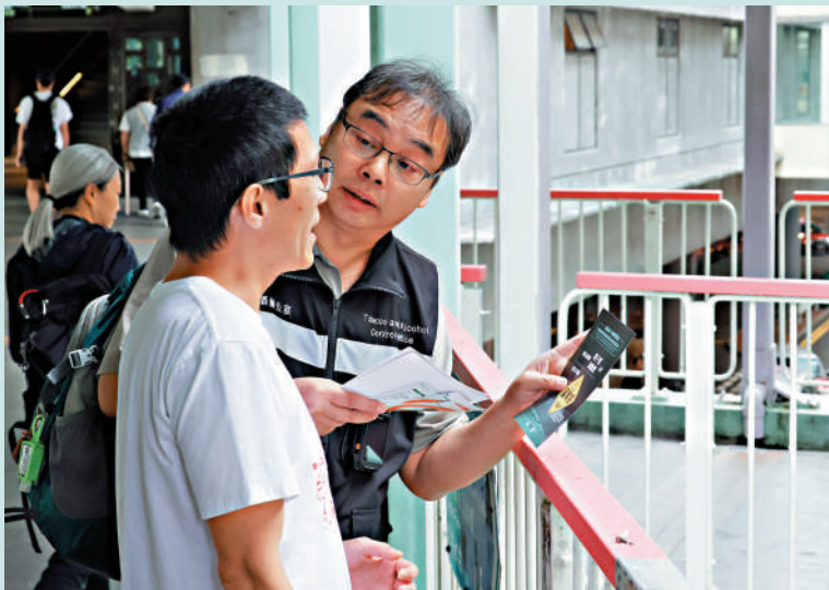
▲禁止在公眾地方管有另類吸煙產品法例昨日起生效，控煙酒辦人員在金鐘一帶派發宣傳單張。

禁止在公眾地方管有另類吸煙產品法例昨日起生效，任何人不得在公眾地方管有另類煙用物質，包括電子煙煙彈、煙油、加熱煙及草本煙，即使隨身攜帶亦屬違法，最高可被罰款50000元及監禁6個月。