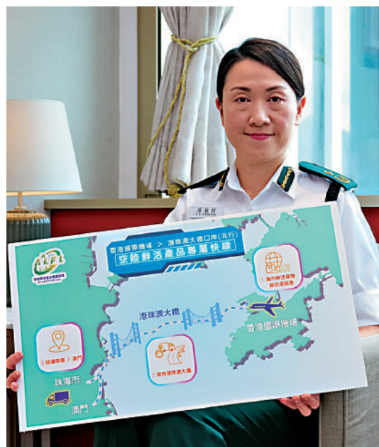
▲香港海關助理關長蔣依莉表示，「鮮活快線」以創新監管模式與科技應用，實現高效、無縫、保鮮的跨境運輸。

記及食品清關要求；設置於港珠澳大橋珠海公路口岸的專屬監管場域，亦設有先進冷凍設施，維持鮮活產品新鮮度，不少活海鮮內地收貨人均對貨物品質深表滿意。