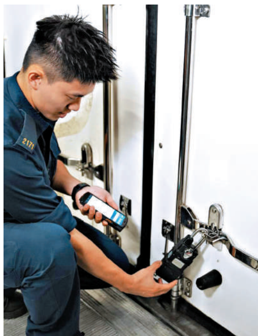
▲海關人員檢查跨境車輛已安裝認可的電子鎖。

科技應用是快線高效通關的關鍵之一。蔣依莉表示，香港海關以建設「智慧海關」為方向，在快線全面應用電子鎖及全球定位系統（GPS），對貨物中轉運輸流程，減少重複查