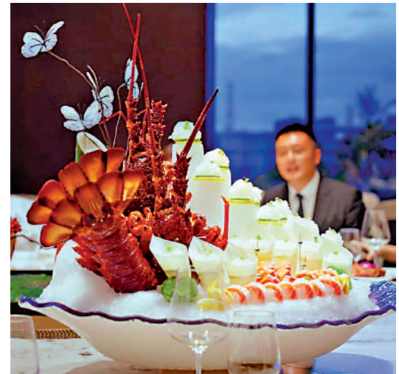
▲海外活龍蝦可在三小時內，由香港機場直送珠海完成清關，然後送到餐桌。