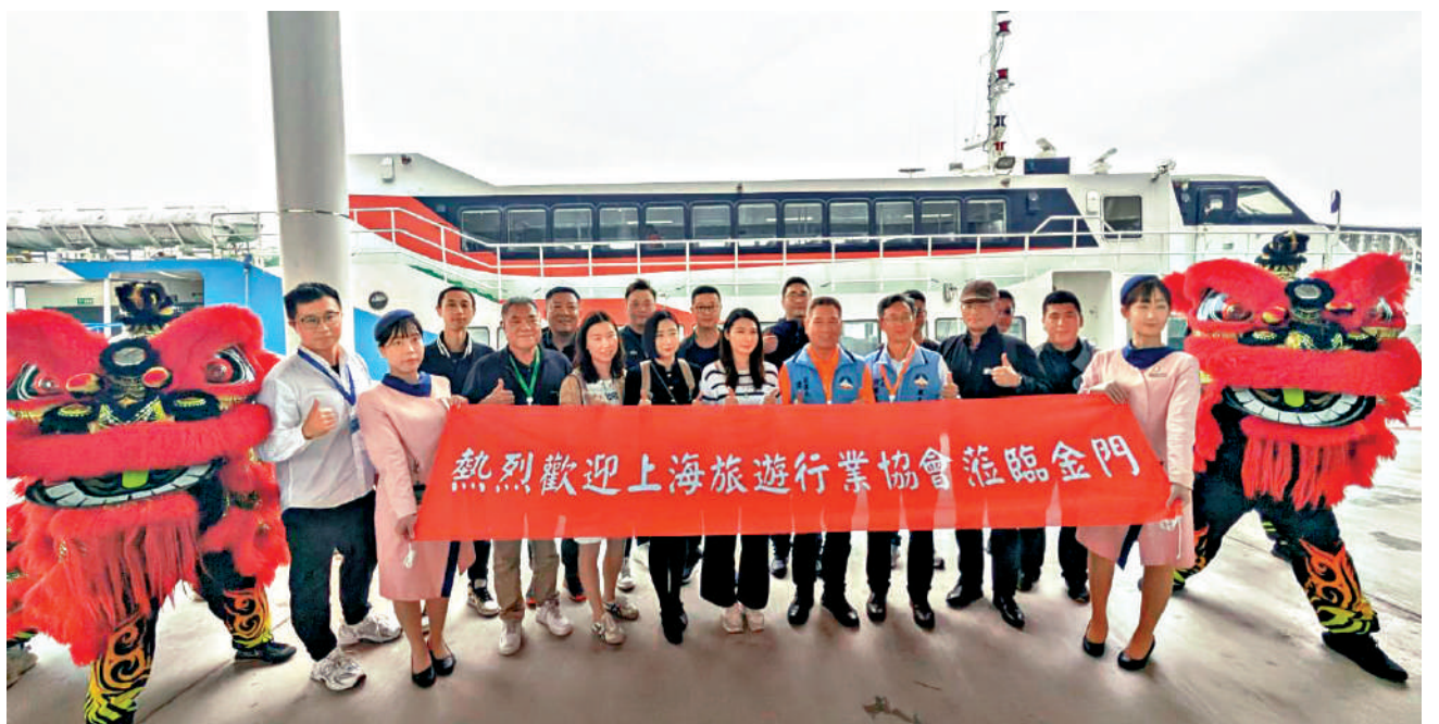
上海旅遊業界線團近日在金門參訪，為上海居民赴金門、馬祖旅遊做準備。

上海旅遊業人士表示，將以「金馬遊」開通為契機，設計出更多符合當下消費者的特色旅遊路線，並為日後恢復赴台灣本島遊做好準備。