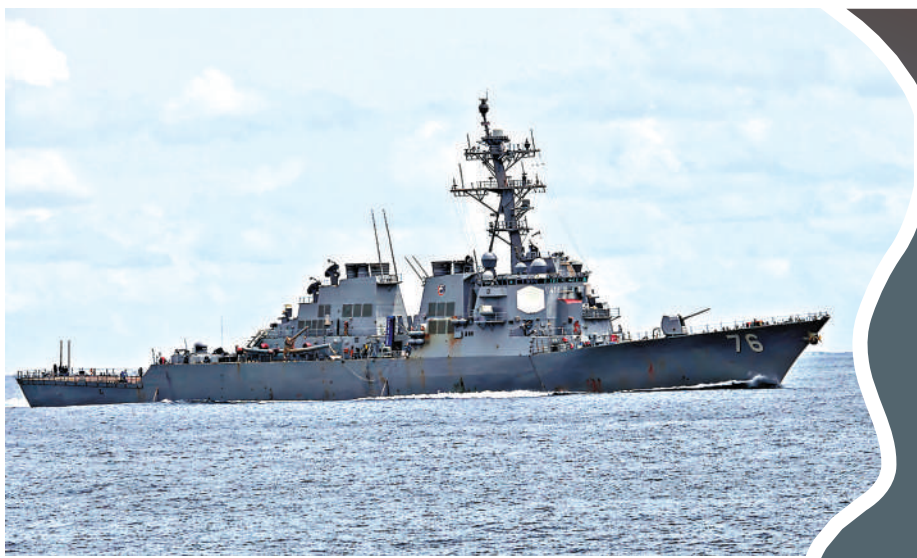
▲美國海軍「希金斯」號驅逐艦4月28日出海時起火。

美媒4月30日報道，隸屬於美國海軍第七艦隊、以日本橫須賀為母港的「希金斯」號導彈驅逐艦，於4月28日出海期間發生火災，直接導致該艦電力與推進系統癱瘓數小時，其間艦艇無法正常航行。這是美國兩個月內第4宗戰艦出現火災。美軍戰艦近年事故不斷，與此同時美海軍領導層也出現動盪。分析認為，美國海軍面臨多重困境之際，而美國總統特朗普仍執意打造所謂「黃金艦隊」，令該計劃前景更加暗淡。