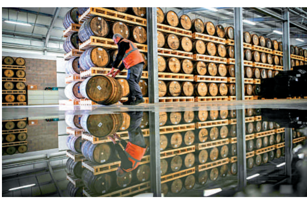
▲蘇格蘭一家釀酒廠倉庫裏擺放着桶裝威士忌。

另外，蘇格蘭威士忌產業高度依賴二手波本桶進行陳釀，而美國波本威士忌使用全新燒焦橡木桶，用完後將二手酒桶賣給蘇格蘭酒廠，每年