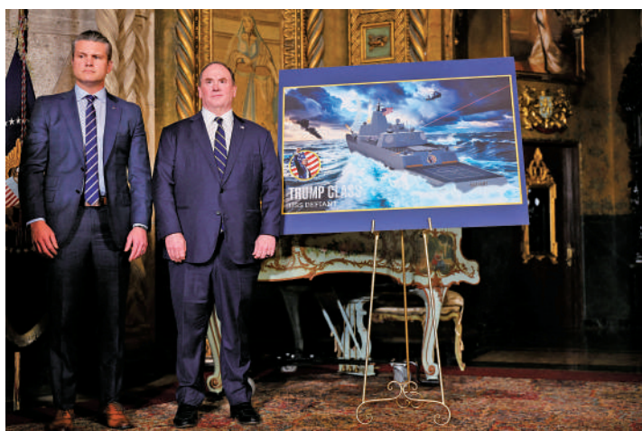
▲去年12月，美國國防部長海格塞斯（左）和時任海軍部長費倫在海湖莊園，出席特朗普宣布「黃金艦隊」計劃發布會。路透社

【大公報訊】美國哥倫比亞廣播公司（CBS）援引美國官員的話稱，「希金斯」號於4月28日發生火災，火勢被控制在單一設備艙室內，並被船員迅速撲滅，也未造成人員傷亡。不過，火災導致全艦電力中斷和推進系統癱瘓數小時。美國退役海軍上校舒斯特指出，由於依靠電力的雷達和防禦系統無法工作，這意味著「希金斯」號失去了自衛能力。