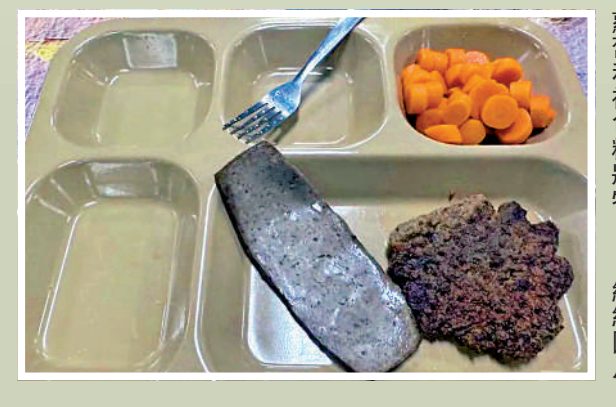
▲美海軍士兵家屬披露的照片顯示，餐盤中僅擺放少量碎肉、胡蘿蔔和褐色糊狀物。

「福特」號返美後，美國「林肯」號和「布什」號航母繼續留守中東，但艦上最基本的伙食保障已經告急。一名「林肯」號水兵的母親表示，自從幾個月前開始部署以來，她的兒子已經減掉了20磅，吃的飯僅有一小勺米飯，上面放了一塊肉乾。另一名男子表示，他曾給艦上一位士兵朋友送去蛋白粉，這名士兵稱自己身體太弱，甚至無法鍛煉。