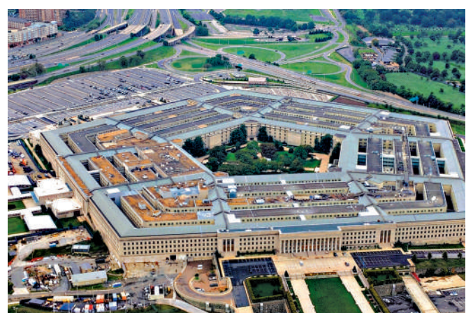
▲美國五角大樓總部。

美國國防部首席技術官邁克爾稱，Anthropic仍然存在「供應鏈風險」，但該公司的AI模型Mythos具備先進的網絡能力，因其能夠增強黑客的能力而在美國官員和企業界引發轟動，是一個「單獨的國家安全時刻」。