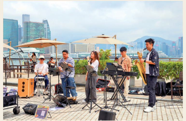
五月一日，香港西九文化區藝術公園及海濱長廊迎來大批市民與遊客。

少年們的快樂便是這樣，不依附於任何理由而存在，它就是我們自己。我們生來就如璀璨的夏日之花，不凋不敗，妖冶如火。風吹來是快樂，雨絲瀟瀟也是快樂，誰買了一根冰棒幾個人分着吃更是快樂。所有的夏天都叫少年，所有的少年都以為自己的夏天不會過完。這就是青春的模樣，也是那個年紀最動人的風景。五四，立夏，憶少年，不似少年是少年。縱然白了鬢髮，而少年們的夏天，早已化作照亮前路星光，並把夢想種進時光，少年不倒，青春無悔！