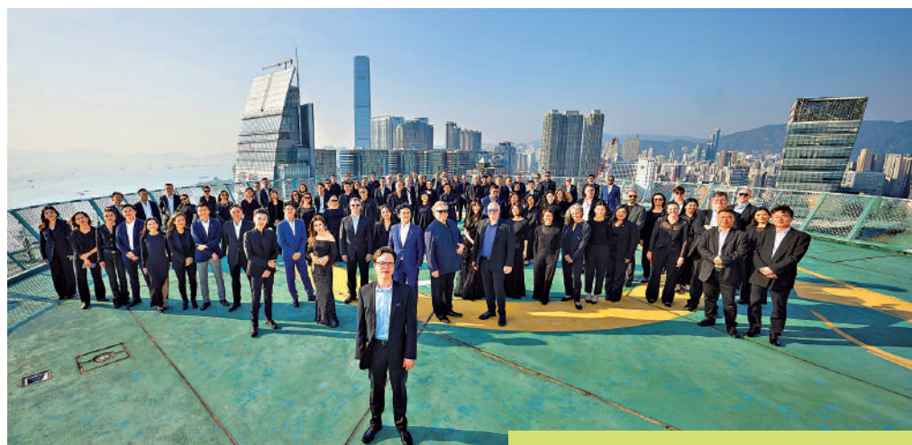
▲香港管弦樂團新樂季以「樂聚好友」(Join Friends)為主題。