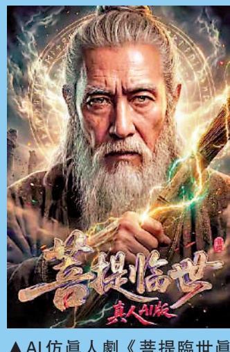
▲AI仿真人劇《菩提臨世真人AI版》超越真人短劇登頂熱播榜。