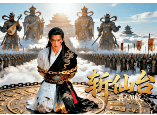
▲「真人+AI」混合製作的《斬仙台》算力成本僅10萬元人民幣。

根據《中國網絡視聽發展研究報告（2026）》，2025年，微短劇人均單日使用時長129分鐘，首次超過長視頻；由AI生成的視頻/音頻累計超過20億條，同比增長超14倍；而四成以上的用戶認為AI生成的內容新奇有趣、更感興趣。