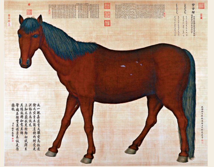
▲（清）艾啟蒙：《寶吉驢圖》軸。 故宮博物院

清代宮廷繪畫突出的藝術風格是中西合璧。康雍乾三朝，相繼有意大利人郎世寧、法國人王致誠、波西米亞（今屬捷克）人艾啟蒙等若干歐洲畫家供職清廷。他們在保持自身西洋畫法同時，學習掌握中國畫筆墨技法，不但自己創作了許多中西畫法融合的作品，而且還將歐洲流行的油畫、銅版畫等畫種，焦點透視等技法（清宮稱「線法畫」），傳授給中國同行。皇帝還具體安排人跟隨他們學畫，比如：「着再將包衣（內務府僕人）下秀氣些小孩子挑六個，跟隨郎世寧等學畫油畫。」以致歐洲油畫，成為清宮僅次於傳統中國畫的又一大畫種。這次展出及未及展出的清宮鞍馬畫，從題材內容到中西繪畫融合的表現技巧，體現了中華文明突出的連續性、創新性、統一性和包容性，具有特殊的歷史和藝術地位。