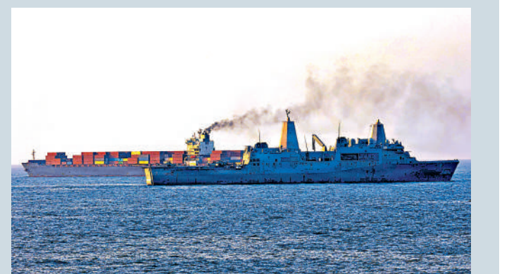
▲美軍上月在阿曼灣扣押伊朗「TOUSKA」號貨船。

談及美伊戰事「結果」時，特朗普表示，認為美國沒有「打贏」的人形同「叛國」，因為「他們（伊朗）已經沒有任何軍隊了」。