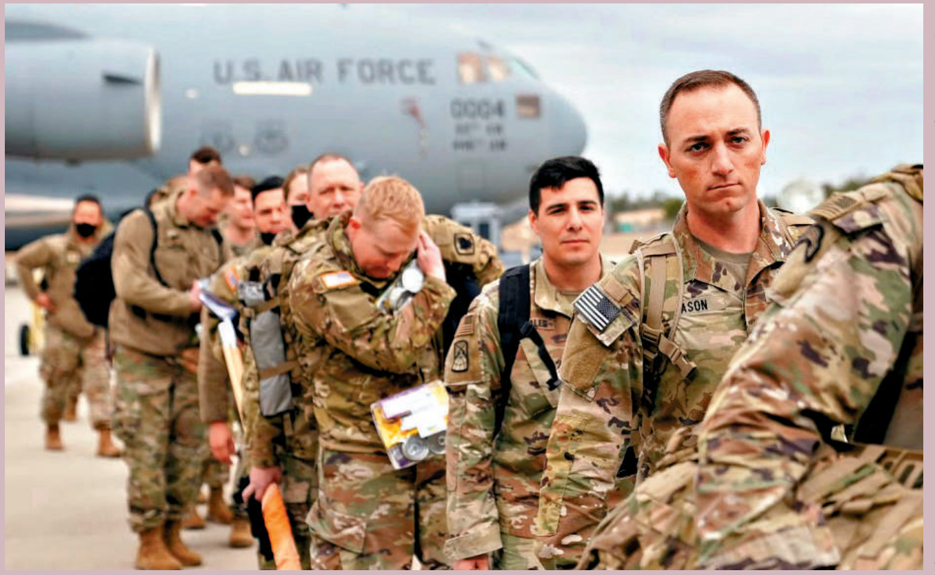
▲五角大樓1日宣布，計劃從德國撤出約5000名美軍士兵。圖為早前部署至歐洲的美軍。

另外，英國《金融時報》引述多名知情人士稱，五角大樓已告知英國、波蘭、立陶宛與愛沙尼亞等歐洲盟友，做好美製武器交付時間延遲的心理準備。美國忙於回補受伊朗戰爭消耗的武器存量，外界預測烏克蘭與美國在亞洲的盟友也受到美國武器短缺的影響。（綜合報道）