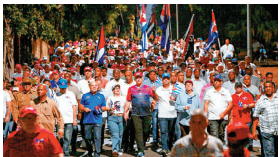
▲民眾1日在古巴首都哈瓦那遊行，反對美國對古巴封鎖制裁及軍事威脅。

古巴外長羅德里格斯指出，堅決反對美國政府新近採取的單邊強制措施。古巴方面此前稱，古巴軍隊正為美國可能發起的軍事侵略做準備。