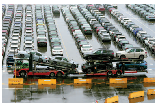
▲比利時澤布呂赫港內等待裝船的新車。

媒體普遍認為，美國此次削減在德駐軍，是特朗普「報復」此前默茨對其批評。默茨4月27日稱，美國在沒有制定任何戰略的情況下對伊朗發起軍事行動，導致進退兩難，被伊朗「羞辱」。特朗普則回應稱，默茨「根本不知道自己在說什麼」。他隨後再度威脅削減