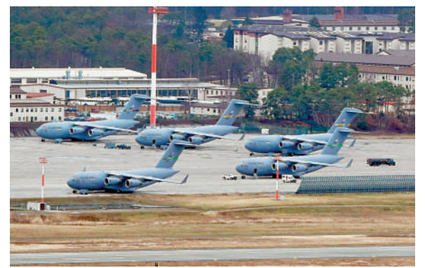
▲德國拉姆施泰因空軍基地內的美軍機。

德國前副總理兼外長菲舍爾表示，北約已開始「解體」，美國長期以來對歐洲的安全保護格局已經終結，歐洲現在必須走出自己的道路。