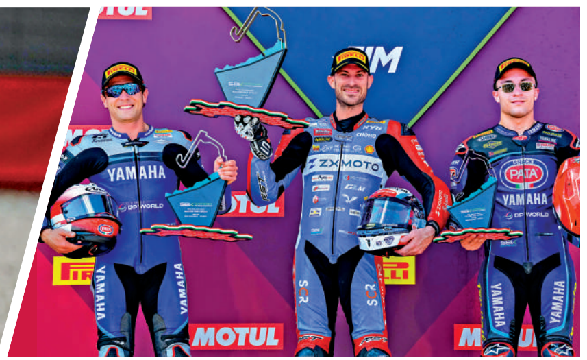
▲「張雪機車」車手迪比斯(中)在頒獎台與亞、季軍車手合照。

2日，在2026世界超級摩托車錦標賽(WSBK)匈牙利站WorldSSP組別第一回合正賽中，中國摩托車製造商「張雪機車」的法國車手迪比斯奪得冠軍。這也是他與「張雪機車」的第三冠。憑藉本場勝利，迪比斯以97分在車手積分榜上升到第三位；「張雪機車」積99分，在製造商積分榜上同樣排名第三。