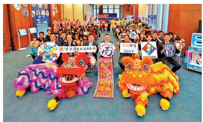
▲逾80名非華裔青年出席活動揭幕儀式。

港順龍仁澤基金會及順德區僑界青年聯合會合辦，揭幕儀式昨日舉行，活動預計吸引數百名非華裔及本地青少年參與，透過短片創作、文化體驗、國情交流、媒體參觀及國安教育等多元活動，從不同角度認識香港、認識國家，並以青年視角呈現多元共融下的香港故事。