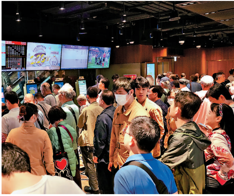
▲六合彩50周年金多寶第一期昨晚攪珠前，大批市民遊客到中環士丹利街投注站碰運氣。

【大公報訊】記者易曉彤報導：六合彩50周年金多寶第一期昨晚攪珠，歷來最高、2.28億元的頭獎由4注瓜分，每注派彩逾5575萬元。昨日不少市民把握最後機會，蜂擁到全港各區投注站「博彩」，位於中環士丹利街、屯門市廣場的幸運投注站尤其熱鬧，排隊買六合彩的人大排長龍。有趁五一黃金周來港的內地旅客，將到士丹利街投注站買彩票納入旅遊行程，期望中頭獎。 馬會為慶祝六合彩推出50周年，推出兩期金多寶，第一期於昨晚攪珠。由於今期頭獎獎金歷來最高，全城掀起買六合彩熱潮，總投注額超過4.1億元。攪珠中獎號碼是2、3、8、28、30、48；特別號碼9。頭獎4注中，每注派5575萬元；二獎36.5注中，每注派34.7萬元；三獎有1153.7注中，每注派逾2.9萬元。