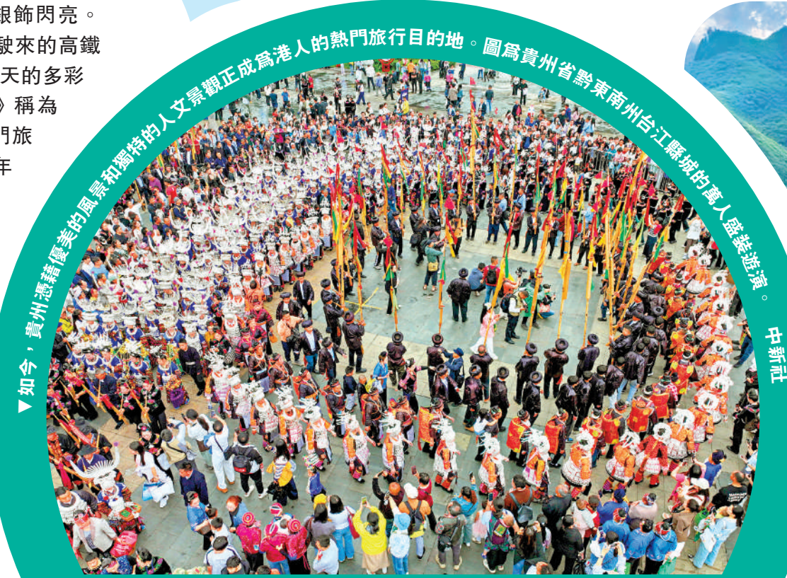
▲ 如今，貴州憑藉優美的風景和獨特的人文景觀正成為港人的熱門旅行目的地。圖為貴州省黔东南州台江縣坡的萬人盛裝游演。

同樣位於黔东南州從江縣的還有加榜梯田，它被《中國國家地理》評為「中國最美梯田」之一。在農曆「三月三」期間，加榜梯田會舉行一年一度的「開秧門」盛典。田埂上，苗族、侗族、布依族村民身着節日盛裝，銀飾在陽光下發出清脆的碰撞聲。祭司站在梯田最高處，用古老的苗語吟唱祈福。隨後，幾位寨老將稻種撒入特製的祭田，標誌一年農耕的開始。一位參與活動的苗族大叔表示，自己家在加榜梯田的耕種歷史已有十代。「每一層梯田都有名字，就像人一樣。那邊叫『雲肩田』，因為它在雲霧環繞的山肩；那邊叫『月亮田』，形狀像彎月。」