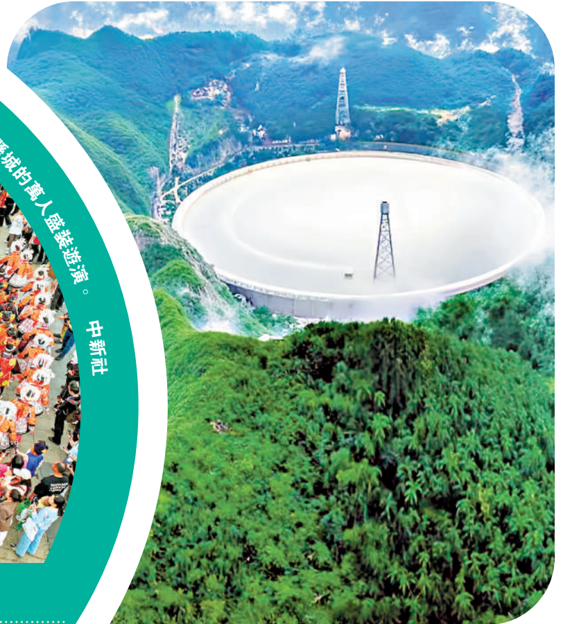
▲ 國之重器「中國天眼」是世界上最大的單口徑射電望遠鏡，也是近年遊客打卡的熱門景點之一。