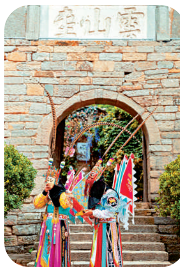
▲ 雲峰屯堡的地戲演員正在表演《三國演義》。

在貴州安順的雲峰屯堡，這裏保存着明代軍屯文化的完整記憶，被譽為「明代歷史的活化石」。屯堡的石門厚重，石板路兩旁，是清一色的石頭房屋，灰白的牆面被歲月染上斑駁。