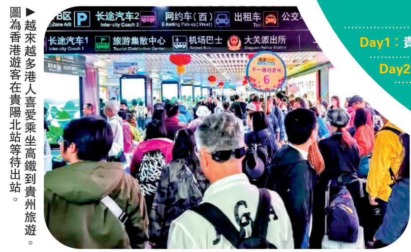
▲ 越來越多的港人喜愛乘坐高鐵路線到貴州旅遊。

走進貴陽市雙龍航空港經濟區，貴陽龍洞堡國際機場附近的貴州長征數字科技藝術館（簡稱「紅飄帶」），大型長征主題情境體驗劇《紅飄帶》正在上演。觀眾站立於一條緩緩前行的傳送帶上，腳下的地面緩緩移動，四周是270度環繞的巨幕。沒有座位，沒有舞台與觀眾席的分界——每個人都成為了行進中的紅軍隊伍的一員。