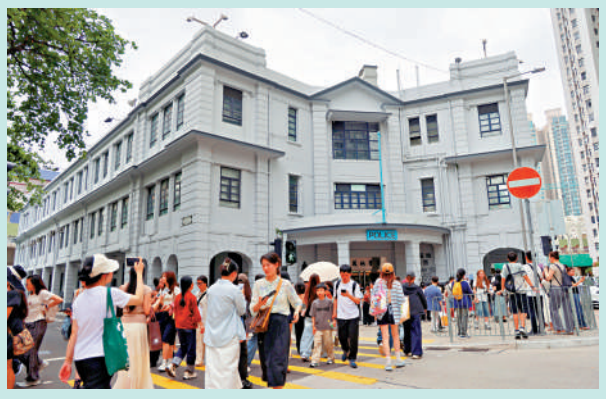
▲訪港旅遊業持續暢旺，五一黃金周首兩天來港旅客按年增加6%。

在外貿方面，今年首季本港出口表現持續強勁，以貨值計上升32%，是連續25個月上升，亦是五年來表現最好的季度。若單計3月份，升幅更達近36%。陳茂波表示，全球人工智能急速發展，帶動各地對相關產品和電子產品的強勁需求，緩減地緣衝突對本地出口和經濟的潛在影響。地緣政局雖帶來一定挑戰，但本港作為國際貿易樞紐，新的增長空間和新的發展機遇也不斷湧現。