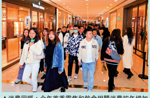
▲消費回暖，今年首季零售和飲食相關消費按年增加5.2%。