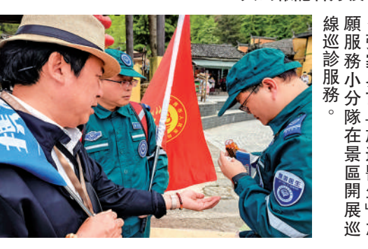
▲張家界市「旅遊醫生」志願服務小分隊在景區開展巡診服務。

讓醫療保障更加智能化、響應更加高效。」張家界市醫療集團總院（市人民醫院）相關負責人表示，這一舉措有效提升了應急救治的精準度和反應速度。此外，針對入境遊客持續增多的特點，張家界市還專門印製中、英、韓多語種健康服務宣傳手冊，在景區服務點向有需要的外籍遊客發放，方便其了解就醫流程和急救常識。 大公報記者方俊明