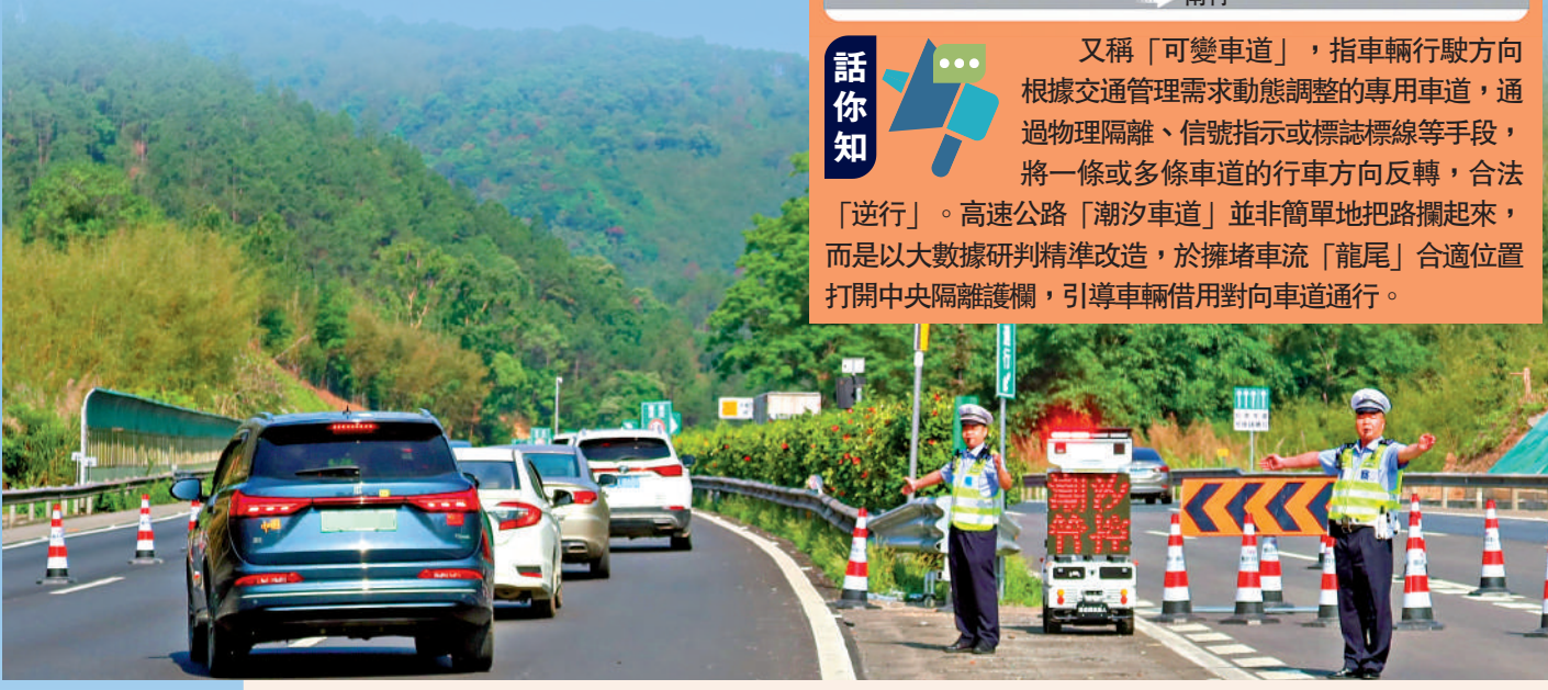
▲廣東高速廣寧服務區，設立「潮汐服務區專用車道」。受訪者供圖 ▶「五一」假期期間，廣東在多條高速的重點路段啟用「潮汐車道」，紓解車流壓力。受訪者供圖