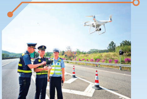
▲廣賀高速廣東段創新運用無人機蜂巢應急處置系統。