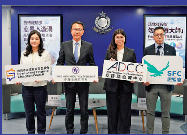
▲警方表示，今年重點打擊網上投資騙案及針對長者群組騙案。

年逾六旬的A女士，擁有投資A股和港股的經驗，偶然在Facebook點擊了自稱投資界名人「郭思治（郭Sir）」提供財經分析的廣告，加入一個名為「港股長線財經焦點」的WhatsApp群組，豈料這竟是噩夢的開始。