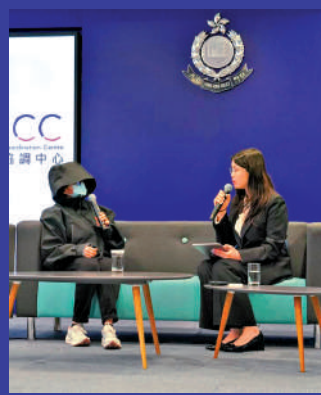
▲A女士（左）誤信自稱「郭Sir」的騙徒，損失逾百萬元。

警方研究數據顯示，約1000名跌入投資騙局受訪長者，17%擁有大學或以上學歷，教育程度愈高，平均損失金額愈高。