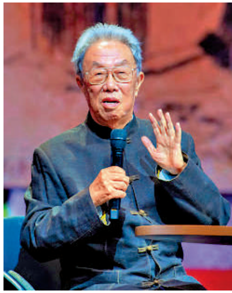
▲作家王蒙的文學創作持續洋溢「青春」的旺盛生命力。

《青春萬歲》以青年之姿記錄了共和國之初的精神風貌。2023年12月21日，「青春作賦思無涯——王蒙文學創作70周年展」在北京開幕。展覽用近300張照片與550多件展品系統梳理總