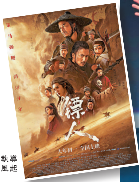
▲袁和平最新執導作品《鏢人：風起大漠》海報。

此外，文創處及香港電影發展局繼續與電影節官方活動 FOCUS ASIA 合作，舉辦 HONG KONG LAB@FOCUS ASIA，邀請來自不同崗位的國際資深電影業界人士與具潛力的香港監製及導演分享合拍片製作、跨境融資及國際發行經驗。活動亦設商業配對環節，協助香港電影人尋找國際同業合作機會。