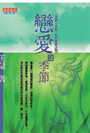
▲長篇小說《戀愛的季節》展現王蒙始終緊扣時代脈搏的創作風格；天下文化出版，2001年。