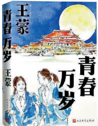
▲《青春萬歲》是王蒙的首部長篇小說；人民文學出版社，2024年。

這些話是王蒙幾十年文學創作和生活的經驗之談，也是一位「永遠年輕」的長者對正進入青春、經歷青春和走過青春者的教誨。