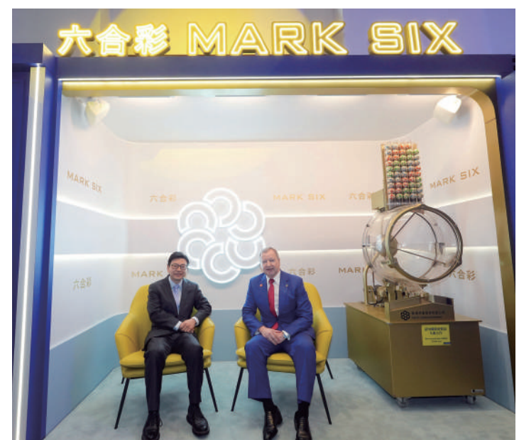
▲香港特區政府勞工及福利局局長孫玉茜(左)和馬會行政總裁應家柏(右)與六合彩退役攪珠機合照。