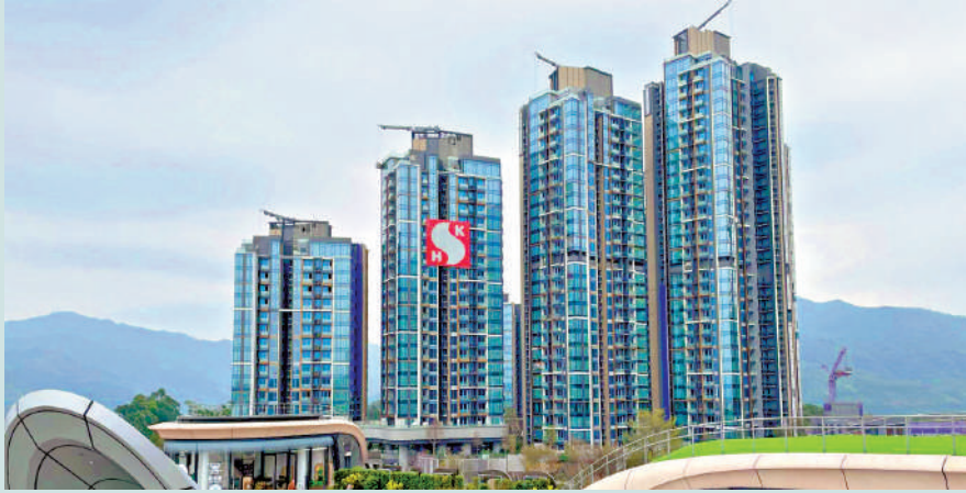
▲西沙SIERRA SEA踏入5月份已錄9宗二手買賣，全數賬面獲利。