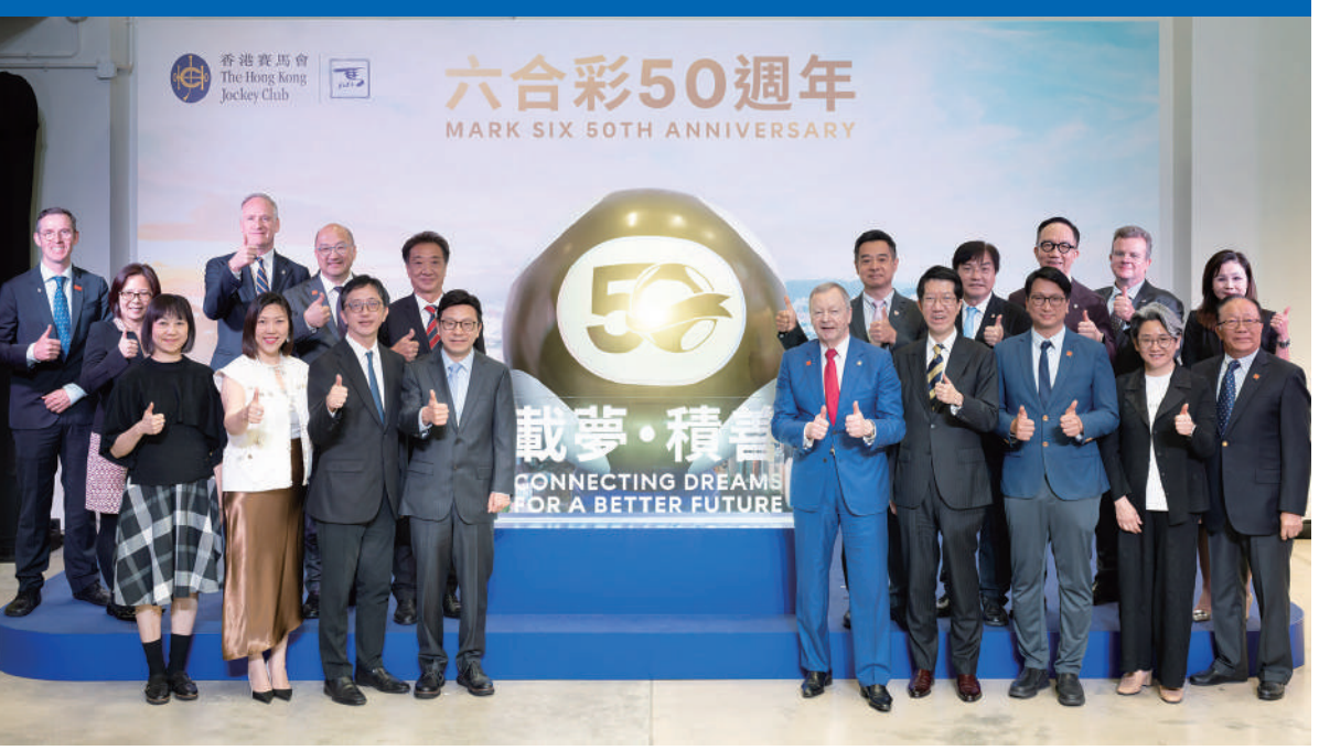
▲香港特區政府勞工及福利局局長孫玉茜(一排左四)、馬會行政總裁應家柏(一排右五)與一眾嘉賓及馬會管理層合照。

展覽優先發售六合彩50周年紀念商品，當中部分商品更為展覽獨家，售完即止。非展覽獨家商品將由5月17日起，在指定馬會場外投注處的「馬場有禮」專櫃、「馬場有禮」門店及網店公開發售。