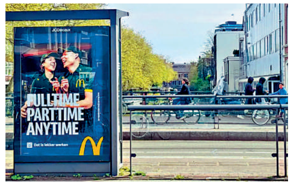
▲荷蘭首都阿姆斯特丹市正式禁止肉類和化石燃料廣告。圖為以前該市街頭的麥當勞廣告牌。

反對人士認為，這項禁令將肉類與航班、柴油汽車等相提並論，不再把吃肉只視作個人飲食選擇，而是上升為氣候治理議題，嚴重干預和限制消費者。