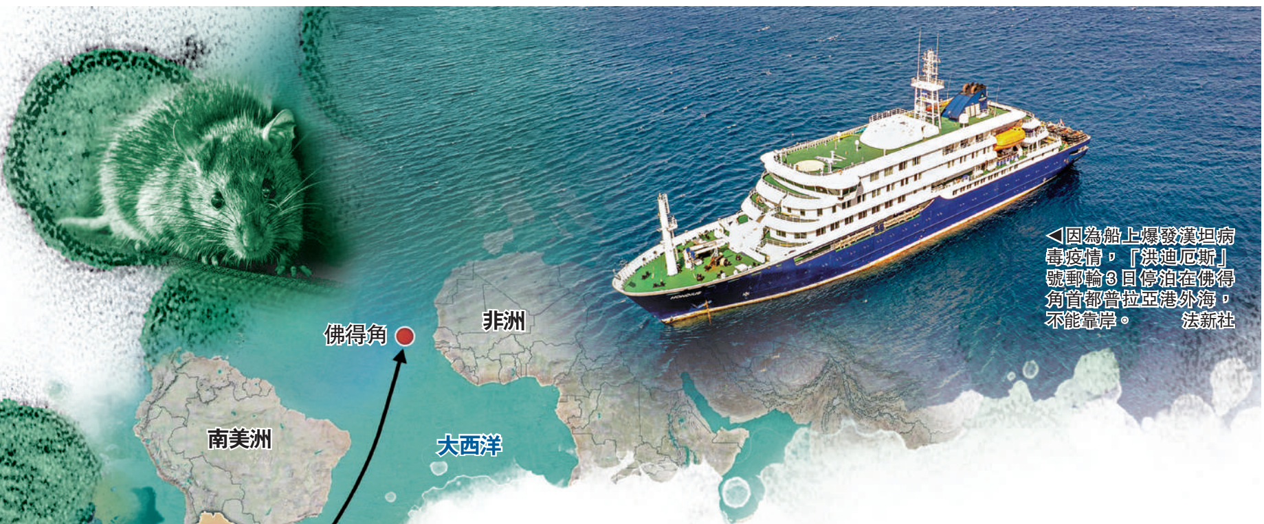
◀因為船上爆發漢坦病毒疫情，「洪迪厄斯」號郵輪3日停泊在佛得角首都普拉亞港外海，不能靠岸。

世界衛生組織（WHO）3日證實，荷蘭郵輪「洪迪厄斯」號出現漢坦病毒疫情，目前已有1宗確診，情況危殆，另有5宗疑似病例，其中3人已死亡，2人出現感染症狀。受此影響，船隻目前停泊在大西洋西非島佛得角首都港口外海，暫不允許靠岸。漢坦病毒主要由齧齒動物傳播，涉事郵輪上的病毒傳播路徑不明。世衛正與相關國家展開緊急調查與救援行動。世衛強調，漢坦病毒人際傳播罕見，公眾面臨的風險較低。