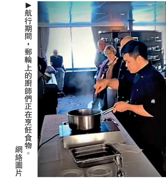
▲航行期間，郵輪上的廚師們正在烹飪食物。

【大公報訊】涉事的「洪迪厄斯」號郵輪由荷蘭海洋遠征公司運營，主打極地旅遊，約三周前從南美洲阿根廷烏斯懷亞出發，其間途經南極洲、福克蘭群島、聖赫勒拿島等。船上載有約149人，來自23個國家，包括88名乘客和61名船員。該公司表示，郵輪上的乘客多在45至65歲之間，年齡跨度從30多歲到80多歲不等。