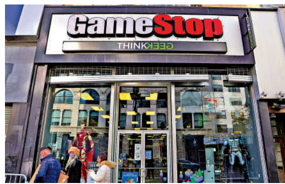
▲電子遊戲零售商 GameStop 計劃收購電商 eBay。圖為美國紐約曼哈頓的一家 GameStop 店舖。

eBay 當前市值高達460億美元，而 GameStop 為120億美元。持有 eBay 約5%的股份