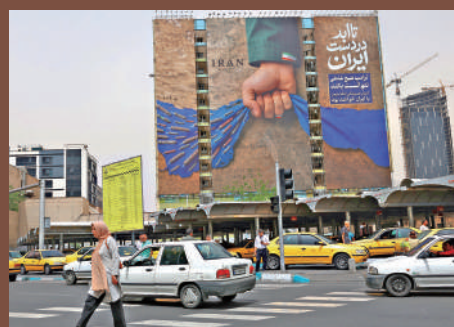
▲伊朗控制霍爾木茲海峽的廣告凸顯決心。