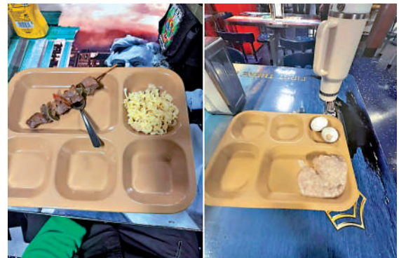
▲部署在中東的美軍艦食物短缺，士兵訴苦吃不飽。

3月以來，美國海軍「福特」號航母、「艾森豪威爾」號航母等4艘軍艦先後發生火災。4月中旬，部署在中東的美軍艦餐食照片曝光，不僅分量極少，質量也堪憂。在美軍緊急「闢謠」後，美媒4月底曝出更多軍艦上食物短缺的照片。