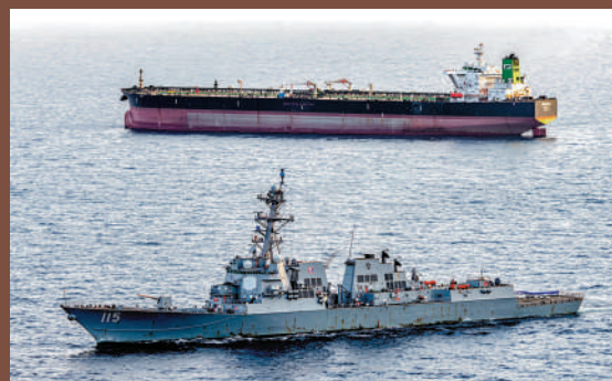
▲美軍一艘導彈驅逐艦（前）在霍爾木茲海峽附近執行對伊朗海上封鎖。網絡圖片