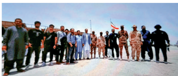
▲此前被美國扣押的伊朗「圖斯卡」號貨輪上的15名船員4日返回伊朗。

據悉，美軍中央司令部司令庫珀已向特朗普提出一項更大膽的計劃，即派遣軍艦穿越霍爾木茲海峽，摧毀伊朗導彈和快艇；如果伊朗升級行動、攻擊海灣國家，美方將「全力重啟戰事」。