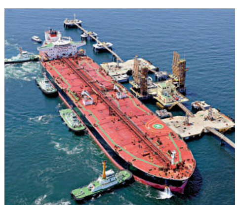
▲一艘運載美國原油的油輪4月26日抵達日本。

此外，阿拉伯石油輸出組織3日發布聲明，確認阿聯酋已正式退出該組織。阿聯酋已於1日退出石油輸出組織（OPEC，又稱歐佩克）及「歐佩克+」。伊朗外交部發言人巴加埃4日說，阿聯酋退出歐佩克是對地區事態發展的消極反應，不具建設性。