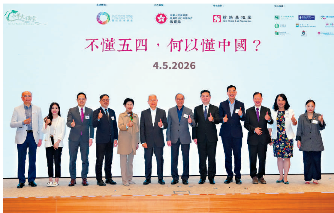
▲團結香港基金昨日舉辦「不懂五四，何以懂中國？」主題講座，講者與嘉賓在台上合照。

影響深遠，之後主宰了中國百年來的政治演變和發展路向，包括今日的改革開放和中國式現代化。