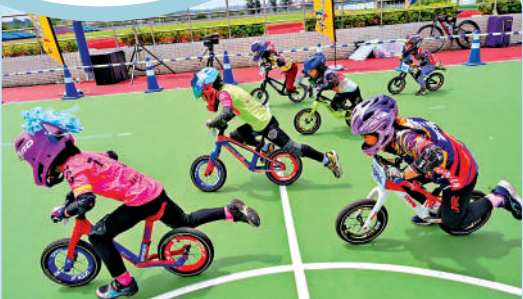
來自大陸的小朋友日前在金門體驗滑步車。