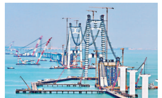
台灣旅遊業者期盼廈金大橋能盡早完工。圖為廈金大橋（廈門段）施工現場。

李正圻進一步指出，廈金航線長期受霧季、颱風季等天氣因素影響，停航時有發生，對兩岸民眾出行、商務往來及旅遊活動造成不便。島內觀光業與基層民眾均熱切期盼廈金大橋盡早規劃建設並通車。他認為，若廈金大橋建成後能參照港澳通行模式優化通關查驗流程、便利人員往來，將顯著提升兩岸跨海通行的穩定性與便捷度，切實增進兩岸同胞民生福祉，為推動兩岸全方位融合發展夯實交通基礎。