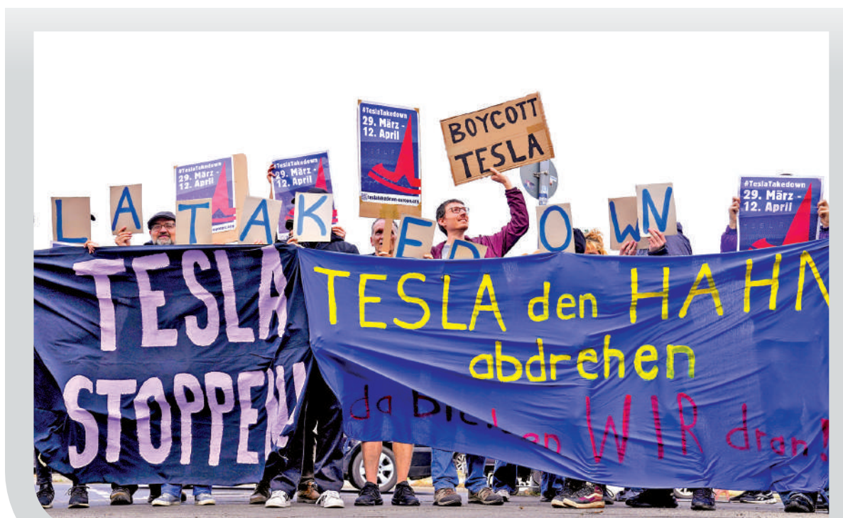
▲德國民眾去年3月在柏林一家特斯拉經銷店前舉行示威。

計劃在今年通過Uber在洛杉磯推出無人的士服務，以及通過Beep在奧蘭多推出服務。