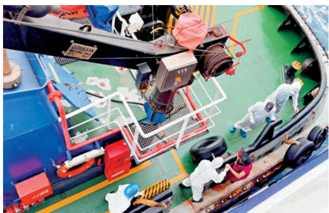
▲衛生防疫人員4日登上爆發漢坦病毒疫情的「洪迪厄斯」號上進行消毒和防疫工作。

世衛最新通報說，截至4日，「洪迪厄斯」號上有乘客發生嚴重急性呼吸道疾病並出現死亡病例的報告已達7宗，兩宗確認為漢坦病毒感染（其中1宗由疑似轉為確診），另有5宗為疑似病例。其中3人死亡，1人