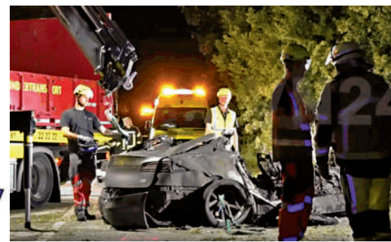
▲去年9月德國西部一輛特斯拉電動汽車撞樹後起火，造成3人死亡。網絡圖片

●汽車銷量下滑：受馬斯克參與政治活動所引發的抗議影響，特斯拉2025年在歐洲的新車總註冊量約為23.8萬輛，較2024年下滑26.9%。今年第一季度，特斯拉歐洲銷量雖有所回升，希望通過自駕技術獲批催谷在歐洲銷量。