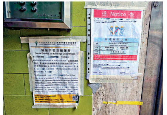
▲旺角塘尾道有不少商住樓宇，部分正在進行大大小小的維修。

一座工廈，室內燈火通明，多名職員正在大聲聊天。記者按鐘並向開門的人士詢問，公司是否與近日廉署反圍標行動有關，對方表示「呢個唔知」，隨後匆匆關門。大公報記者 姚棠