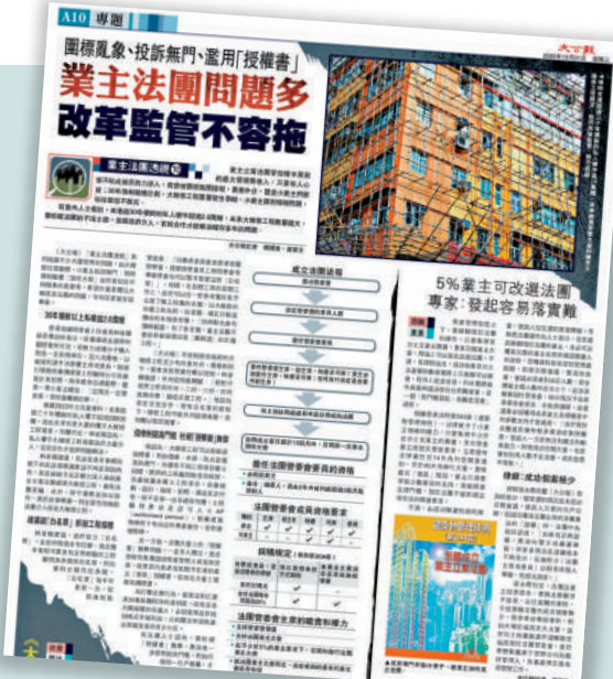
▲《大公報》去年推出「業主法團透視」系列報道，深入調查大廈管理問題，揭露大維修圍標、惡勢力滲入等違規操作，引起廣泛關注。