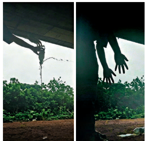
▲12歲男童在網上發布實驗片段，聲稱成功製成炸藥。

男童企圖製造炸藥的地點，位於清水灣半島對出的天橋底，昨日現場所見，空地上懷疑事發位置，有一個凹陷位置。有住在附近的學生表示，近日沒有發現異常；有居民認為製造炸藥十分危險，因為炸藥隨時爆炸，導致事主及其他人受傷。