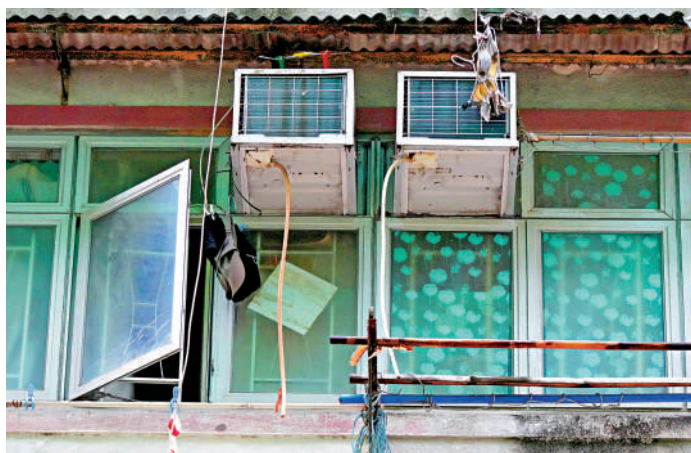
▲食環署本月起展開大規模打擊冷氣機滴水行動，在全港選定超過300個冷氣機滴水黑點加強執法。

食環署在夏季來臨前已提早加強宣傳教育，提高市民對冷氣機滴水的認知和責任感。過去兩周，食環署人員在全港各區進行一系列宣傳活動，包括緊密聯絡各區民政事務處、區議會和地區委員會，透過地區網絡推動市民正視和跟進滴水問題，並獲得各區區議會和地區組