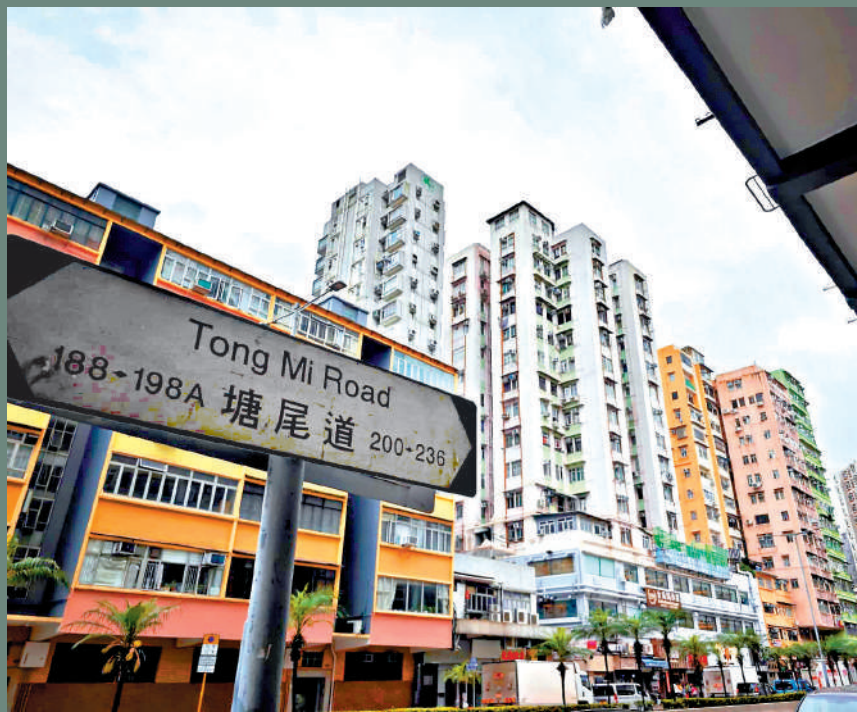
▲廉署拘7人涉樓宇大維修工程案，據了解，涉事大廈位於旺角塘尾道。

另外，廉署在行動中發現，涉案工程顧問公司及承辦商，試圖透過隱瞞關係和利益衝突，以取得另外兩個位於大坑及深水埗的樓宇大維修項目，有關工程正進行招標，合約價值共約600萬元。廉署表示，行動已成功堵截有關非法行為，過程中已提醒相關業主代表判授合約時要留意的貪污風險，案件仍在調查，不排除再有進一步執法行動。